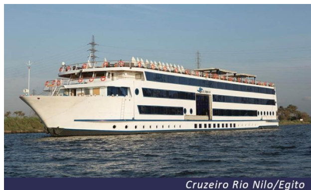
Cruzeiro Rio Nilo/Egito