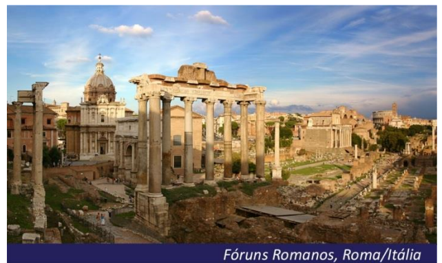
Fóruns Romanos, Roma/Itália