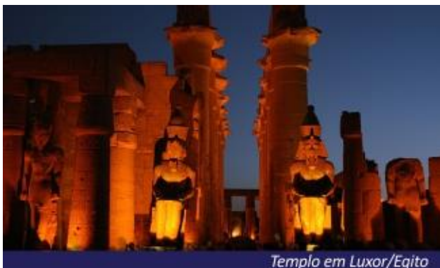
Templo em Luxor/Egito