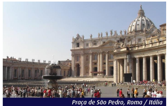
Praça de São Pedro, Roma / Itália