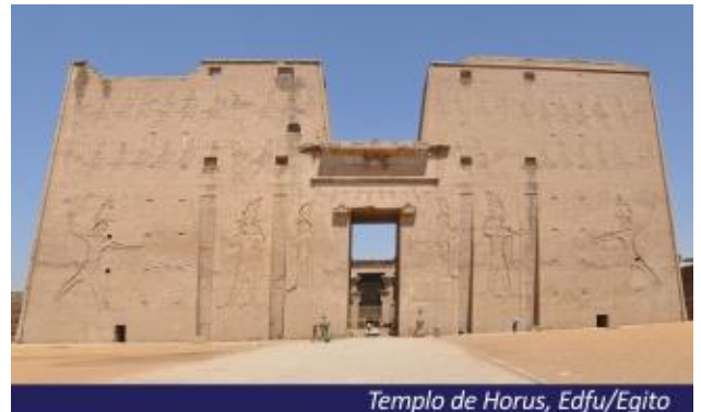
Templo de Horus, Edfu/Egito

Café da manhã, em horário apropriado saída para o aeroporto internacional do Cairo e embarque de regresso ao Brasil.