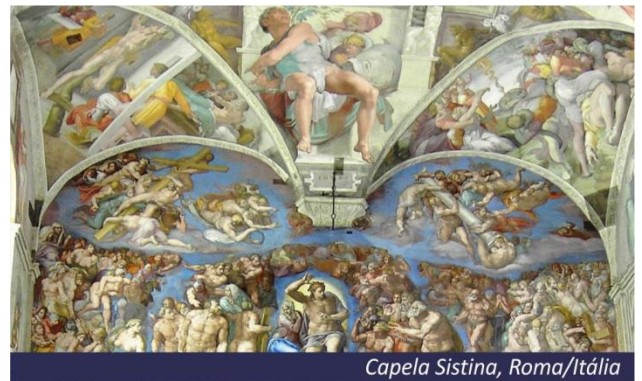
Capela Sistina, Roma/Itália