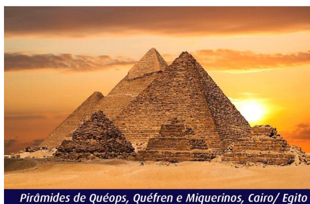
Pirâmides de Quéops, Quéfren e Miquerinos, Cairo/ Egito

Após o café da manhã buffet, no hotel, visita ao Museu Egípcio, um dos mais espetaculares do mundo. Fortaleza de Saladino, Mesquita de Alabastro ou Mohamed Ali, Grande Mercado Khan El Khalili. Visita ao Cairo antigo. Almoço incluído. Hospedagem.