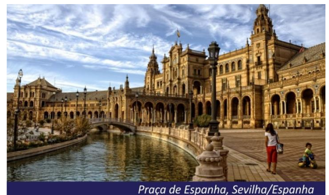
Praça de Espanha, Sevilha/Espanha

Café da manhã no hotel e saída para uma clássica visita de Sevilha. Sevilha é uma cidade espanhola situada a sudoeste da península ibérica, e a capital da província homônima, na comunidade autônoma da Andaluzia. Um dos grandes atrativos dessa belíssima cidade é sem dúvidas a sua catedral, também conhecida como Catedral de Santa Maria da Sede, sendo a maior catedral da Espanha e o terceiro maior templo do mundo, atrás da basílica de San Pedro no Vaticano, e a catedral de São Paulo em Londres. A catedral de Sevilha foi declarada patrimônio da humanidade pela UNESCO no ano de 1987, integrado no Sítio Catedral, Alcázar e arquivo das Índias. Outras atrações turísticas de interesse são: a Torre Del Oro, a Plaza de España, o Bairro de Santa Cruz, entre outros. Tarde livre e hospedagem.