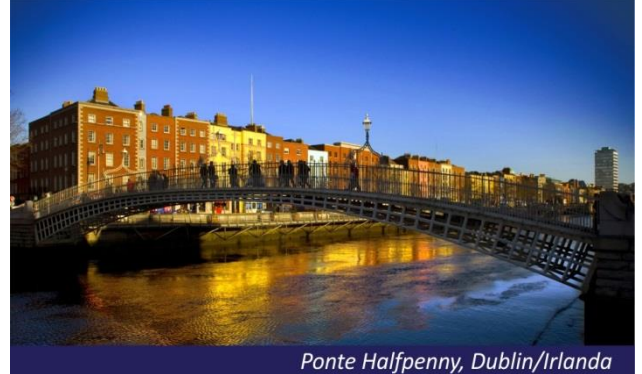
Ponte Halfpenny, Dublin/Irlanda