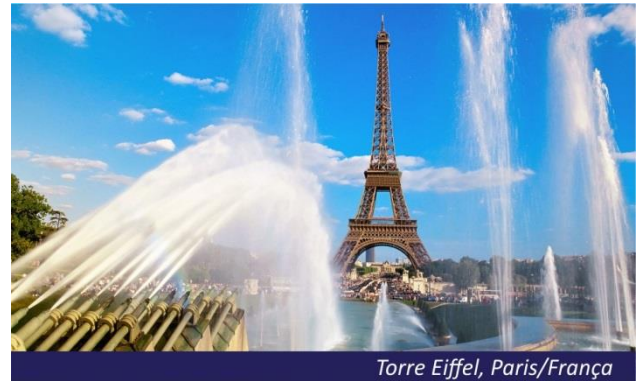
Torre Eiffel, Paris/França

Café da manhã no hotel e, em horário apropriado, traslado ao aeroporto para embarque com destino ao Brasil.