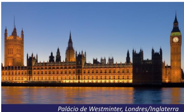
Palácio de Westminster, Londres/Inglaterra

Após o café da manhã, desembarque do navio ROYAL PRINCESS e saída para a estação de para embarque no trem de alta velocidade EUROSTAR com destino a Paris. Chegada e hospedagem. Restante do dia livre para atividades independentes.