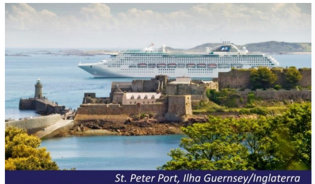
St. Peter Port, Ilha Guernsey/Inglaterra

De uma posição estratégica invejável, uma fartura de recursos marinhos e naturais extraordinária, um clima muito suave em relação à vizinha Inglaterra e nenhum imposto adicional cobrado. Os habitantes das ilhas do canal das quais Guernsey e Jersey fazem parte podem, realmente, sentir-se muito satisfeitos. A sua história e tradição antiga garantem, já há quase oitocentos anos, a todos os habitantes deste arquipélago inglês em terra "quase" francesa alguns privilégios invejados por todos os súditos da Grã-Bretanha. Chegada às 06h e partida às 17h. Sugerimos a escolha de uma excursão opcional. Pensão completa a bordo.