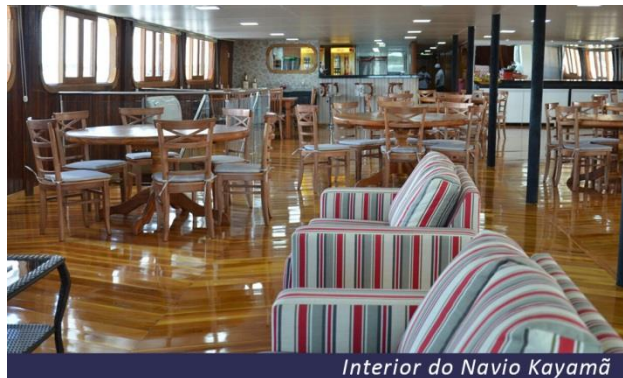
Interior do Navio Kayamã