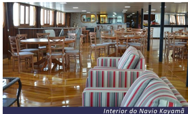
Interior do Navio Kayamã