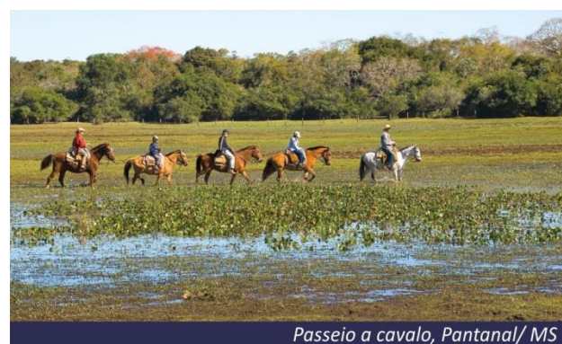
Passeio a cavalo, Pantanal/MS