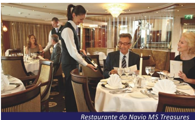
Restaurante do Navio MS Treasures

Neste dia visitaremos a extraordinária Abadia de Melk, que foi originalmente um palácio e fica situada sobre uma rocha com vista para o Danúbio. Localizada às margens do Rio Danúbio, entre Salzburgo e Viena, a Abadia de Melk está coroada por duas torres de um resplandecente tom dourado. A impressionante estrutura barroca de Melk foi construída entre 1702 e 1736 pelo arquiteto Jakob Prandtauer. Especialmente dignos de nota destacamos a igreja, com afrescos magníficos de Johann Michael Rottmayr e a biblioteca que contém inúmeros manuscritos medievais. A comunidade de monges de Melk tem mais de 900 anos e mantém suas paredes com afrescos. Ainda podem ser vistos monges beneditinos, vestidos com as características vestimentas pretas, passeando em meio às esculturas de mármore. Após a visita início da navegação para Linz. Pensão completa a bordo.