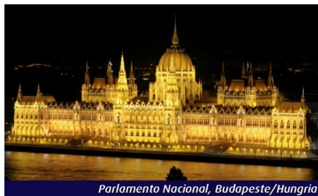
Parlamento Nacional, Budapeste/Hungria

pelos montanhas dos Cárpatos e banhada pelo Danúbio. A cidade ocupa uma localização privilegiada. O charme da capital eslovaca é seu centro histórico, com esplêndidos palácios barrocos, igrejas e praças agradáveis. À noite início da navegação para Viena. Pensão completa a bordo.