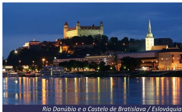
Rio Danúbio e o Castelo de Bratislava / Eslováquia

Após o café da manhã, visita de Viena. No nosso city tour trafegando pela Ring Strasse - o anel que circunda a cidade, veremos a Ópera de Viena, os prédios da Prefeitura, a Catedral Gótica e o Palácio de Schönbrunn, antiga residência de verão da família Imperial e o preferido da Imperatriz Maria Tereza. Pensão completa a bordo.