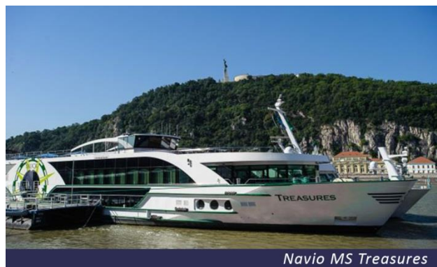
Navio MS Treasures