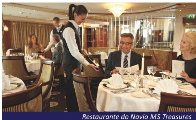
Restaurante do Navio MS Treasures