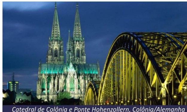
Catedral de Colônia e Ponte Hohenzollern, Colônia/Alemanha