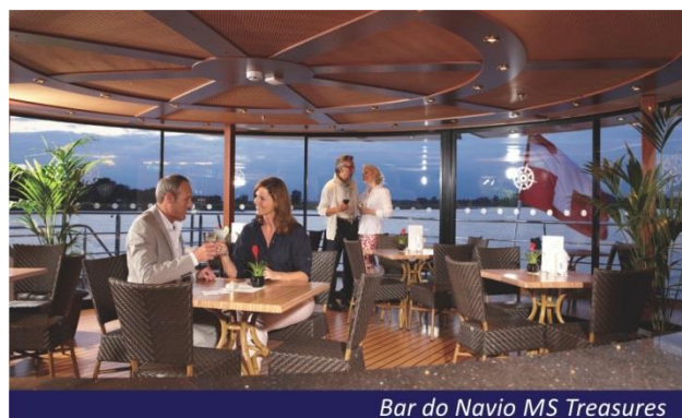
Bar do Navio MS Treasures