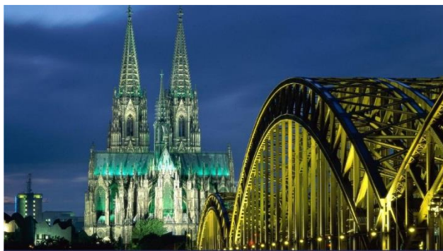
Catedral de Colônia e Ponte Hohenzollern, Colônia/Alemanha

Pela manhã, sugerimos excursão opcional em Colônia. A cidade é um dos mais importantes portos fluviais alemães e considerada a capital urbana, econômica, cultural, administrativa e histórica da Renânia. Com mais de um milhão de habitantes, Colônia é a 4.ª maior cidade alemã e a 16ª maior cidade da União Europeia em população. A monumental catedral de Colônia começou a ser construída em 1248, mas as obras só foram concluídas em 1880. Na época era a construção mais alta do mundo, com torres de 157 metros de altura. Lá estão guardados alguns tesouros, como a Madonna de Milão e os restos mortais dos três reis magos, guardados em uma urna no formato de basílica, com 74 imagens de prata banhadas a ouro. A "água-de-colônia 4711", tem uma história curiosa: Quando Napoleão invadiu a cidade, ordenou uma renumeração de todas as casas para maior controle, e coube aos donos da fábrica da água-de-colônia o 4711. Napoleão se foi e o número ficou. O prédio histórico da prefeitura revela a importância de Colônia como a grande metrópole da Idade Média. Logo em frente a edificação, há vestígios de várias épocas, como as ruínas do palácio do governo no período de ocupação pelos romanos. Após a visita, retorno ao navio para almoço. Tarde livre em Colônia. À noite, início da navegação para Rudesheim. Pensão completa a bordo.