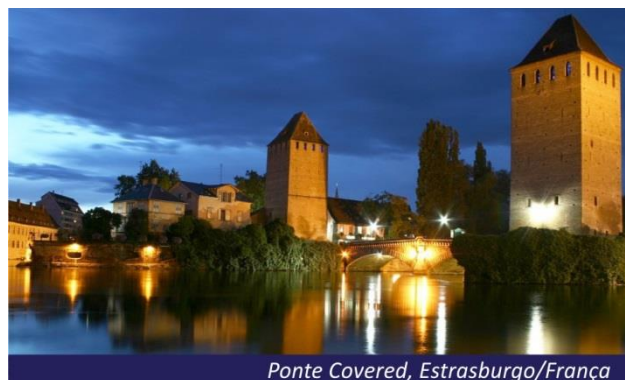
Ponte Covered, Estrasburgo/França

Manhã de navegação. Após o almoço, sugerimos excursão opcional em Estrasburgo. Essa linda cidade é a capital da região da Alsácia e desde 1998 sedia o tribunal europeu dos direitos humanos. A cidade possui uma rica história e maravilhosa arquitetura. Seu centro antigo é Patrimônio Mundial da UNESCO desde 1988. Vale destacar a catedral de Notre Dame e o bairro Petit France. Pensão completa a bordo.