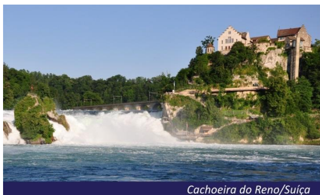
Cachoeira do Reno/Suíça

Pela manhã, excursão opcional para conhecer as cataratas do Reno e o lago de Constanza. As cataratas do Reno se encontram entre as belezas naturais da Suíça, que são, sem dúvida, uma das mais espetaculares para se visitar. Descobriremos o castelo de Laufen, onde se poderá viver a experiência de ver as cataratas do Reno mais de perto. Pensão completa a bordo. Hospedagem.