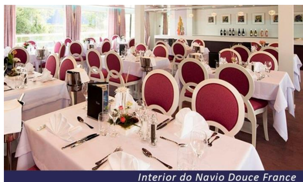
Interior do Navio Douce France

declarada Patrimônio da Humanidade, é um dos grandes pontos turísticos da Alemanha. A região foi primeiro colonizada pelos celtas, sucedidos pelos romanos, alamanos e francos, cujas culturas deixaram vários sítios arqueológicos importantes nas redondezas. A povoação apareceu documentada pela primeira vez em 1074, e somente em 1818 recebeu status de cidade. Hoje é um ativo ponto turístico por causa de suas construções históricas, museus, festivais e centros de cultura, e tem grande produção de vinhos. Pensão completa a bordo.