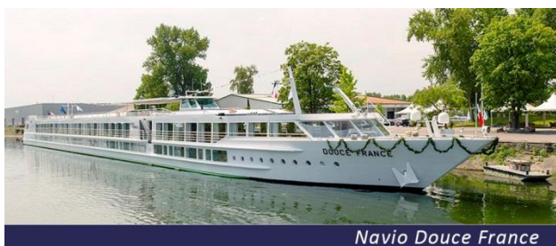
Navio Douce France