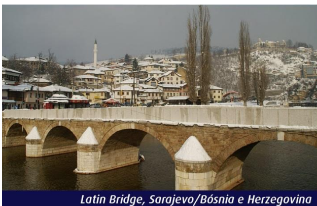
Latin Bridge, Sarajevo/Bósnia e Herzegovina