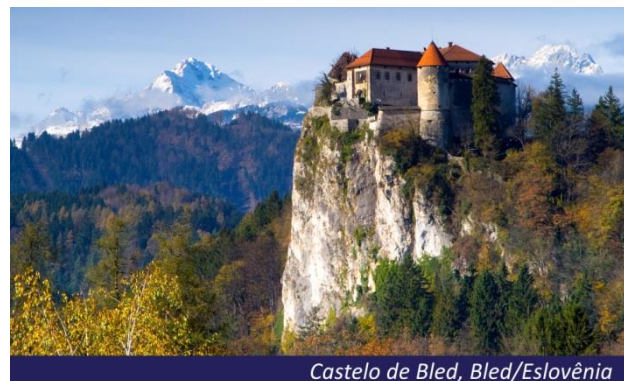
Castelo de Bled, Bled/Eslovênia

Café da manhã no hotel e saída até Bled, cidade bonita e tranquila localizada no Parque Nacional de Triglav. Chegada e visita ao Castelo de Bled, onde, se o tempo permitir, teremos uma fantástica e panorâmica vista do Lago e das montanhas que o rodeiam. Continuaremos até a ilha para embarcar a bordo do "Pletna", embarcação típica de madeira, até a ilha situada no centro do lago, com visita à igreja Barroca. Retorno a Ljubljana e resto do dia livre.