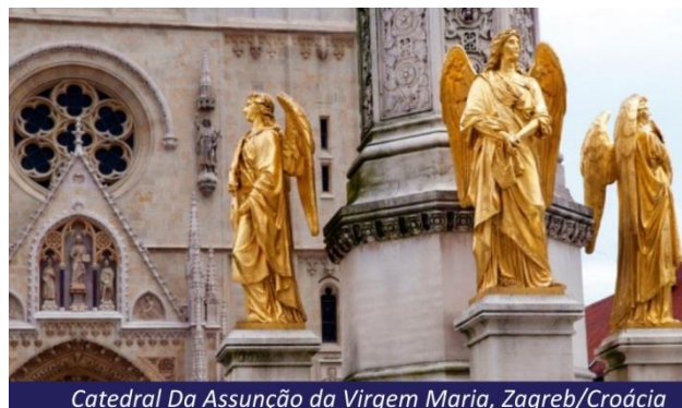
Catedral Da Assunção da Virgem Maria, Zagreb/Croácia

Segunda cidade da Croácia em tamanho e coração da Dalmácia, Split foi originalmente um palácio que Diocleciano tinha construído na periferia da grande cidade de Salona. A partir daí, durante a idade média, os habitantes de Salona ocuparam e modificaram a região, para criarem a cidade atual. Do palácio de Diocleciano, da época romana, só resta o pátio relativamente bem conservado. O antigo mausoléu de Diocleciano foi transformado em catedral desde o final do século VII, mantendo sua estrutura original, cercado por 24 colunas. A visita permitirá também descobrir o pátio do Peristilo, o templo de Júpiter e a catedral de São Damião. Hospedagem.