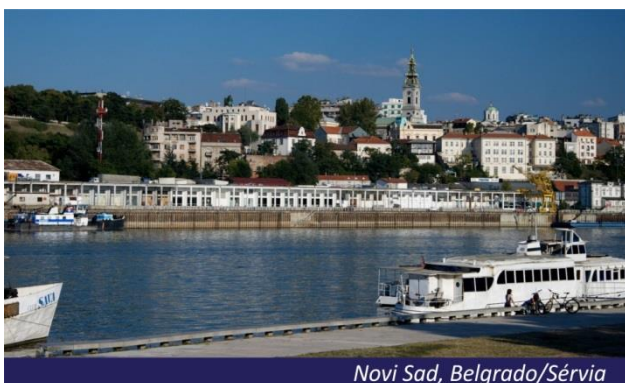
Novi Sad, Belgrado/Sérvia