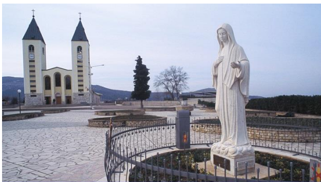
Igreja de St. James, Medjugorje/Bósnia e Herzegovina

construída em 1618, e o Muslibegovica House (localizado perto do Karadoz - Mesquita Bey), construída há 300 anos, e considerada a casa mais bonita do período otomano nos Bálcãs. Após a visita continuação até Dubrovnik. Hospedagem.