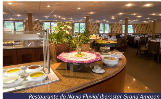
Restaurante do Navio Fluvial Iberostar Grand Amazon

Café da manhã no hotel, e em horário oportuno traslado ao aeroporto para embarque de retorno.