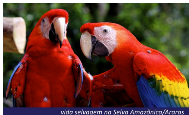
vida selvagem na Selva Amazônica/Araras