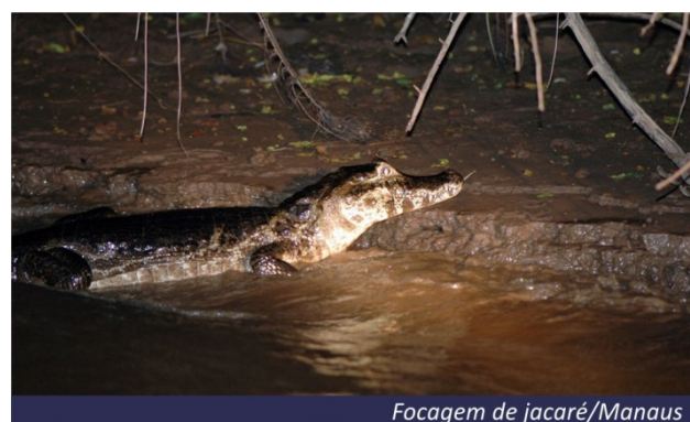
Focagem de jacaré/Manaus