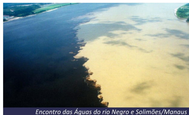
Encontro das Águas do rio Negro e Solimões/Manaus