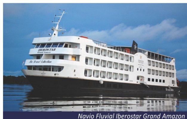
Navio Fluvial Iberostar Grand Amazon

áureo da borracha. De lá, seguimos para visitação interna ao Mercado Municipal Adolpho Lisboa, em estilo ArtNoveau. O mercadão é um importante centro de comercialização de produtos regionais que mostra os hábitos, a cultura e as tradições do povo amazônico. Embarcaremos no Cruzeiro Iberostar Grand Amazon, e a tarde iniciaremos nossa navegação pelo Rio Solimões. Aprecie um lindo pôr do sol no terraço com música ambiente. Inscrições na recepção, até às 20h, para as excursões do próximo dia. Às 19 horas será servido um coquetel de boas-vindas oferecido pelo capitão no Salão Lua, com apresentação da tripulação, dos equipamentos a bordo e dos procedimentos de segurança. Jantar no restaurante Kuarup.