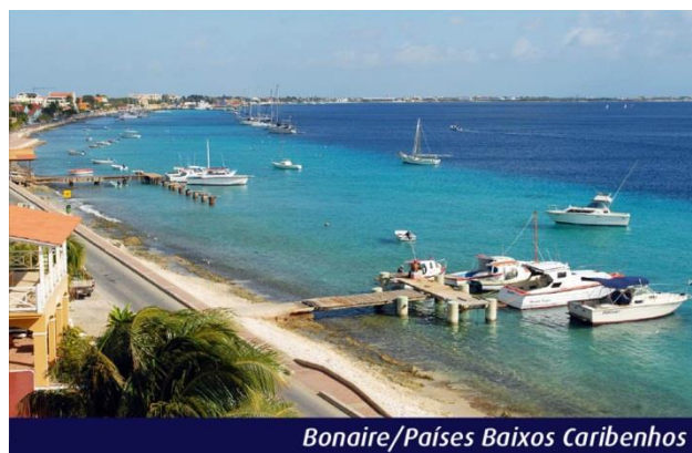
Bonaire/Países Baixos Caribenhos

Curaçao se destaca pelas praias cristalinas, de azul profundo e límpido, perfeitas para mergulho. Explore as praias da ilha, ande a pé por seu centrinho e aprecie as casas coloridas desta pacata ilha. Sugerimos a escolha de uma excursão opcional. Pensão completa a bordo.