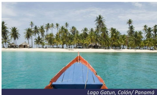
Lago Gatun, Colón/ Panamá

Chegada, desembarque e traslado para a Cidade do Panamá com parada para tour de compras.