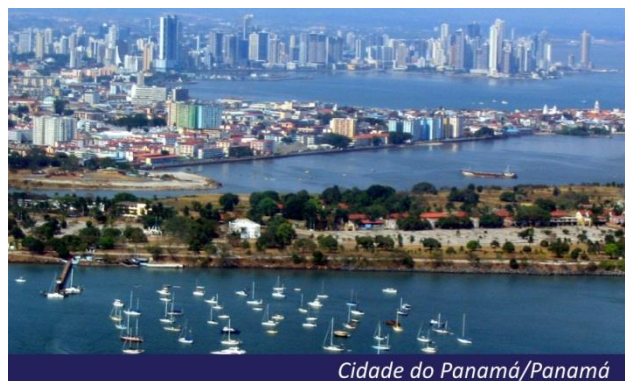
Cidade do Panamá/Panamá

Panamá (Cidade do Panamá, Colón), Colômbia (Cartagena das Índias), Curaçao , Bonaire (Países Baixos Caribenhos), Aruba