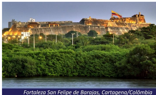
Fortaleza San Felipe de Barajas, Cartagena/Colômbia