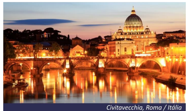
Civitavecchia, Roma / Itália