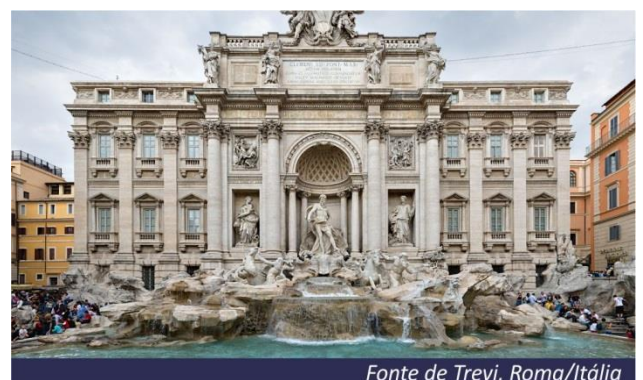
Fonte de Trevi, Roma/Itália