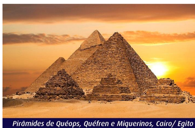
Pirâmides de Quéops, Quéfren e Miquerinos, Cairo/ Egito

Após o café da manhã no hotel, visita ao Museu Egípcio, um dos mais espetaculares do mundo. Fortaleza de Saladino, Mesquita de Alabastro ou Mohamed Ali, Grande Mercado Khan El Khalili. Visita ao Cairo antigo. Almoço incluído. Hospedagem.