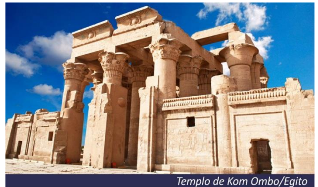
Templo de Kom Ombo/Egito