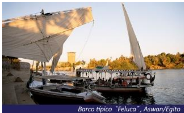
Barco típico "Feluca", Aswan/Egito

Café da manhã no hotel, traslado ao aeroporto, e embarque com destino a Luxor para início do Cruzeiro pelo Rio Nilo. Almoço incluído. Chegada, traslado e visita aos Grandes Templos de Karnak e Luxor. Logo após, embarque em cruzeiro pelo Rio Nilo. Jantar a bordo.