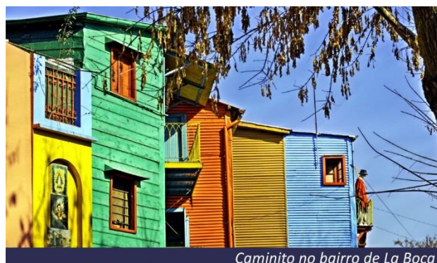
Caminito no bairro de La Boca

Café da manhã no hotel e saída para city tour em Buenos Aires. Iniciaremos nosso passeio pelo Teatro Colón e Plaza de Mayo: Epicentro histórico, político da capital argentina. Destaque para a Catedral Metropolitana, Palácio do Governo e a Prefeitura. Logo após chegaremos a San Telmo, um bairro boêmio onde encontram-se muitos antiquários e os famosos cafés tradicionais argentinos. Em seguida chegaremos a La Boca onde fica o famoso Caminito, uma rua tradicional com suas casas coloridas onde foi composto o famoso tango Caminito. Conheceremos os bairros de Puerto Madero, Retiro, a Plaza San Martín, Avenida Libertador e Palermo, bairro residencial com parques e elegantes edifícios. Antes de retornar ao hotel visitaremos a Recoleta, um dos bairros mais exclusivos, onde entre outras atrações, encontramos o famoso cemitério, cafés e restaurantes. Hospedagem.