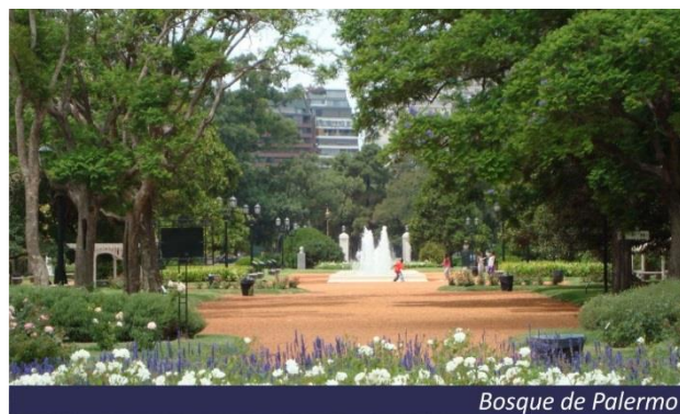
Bosque de Palermo