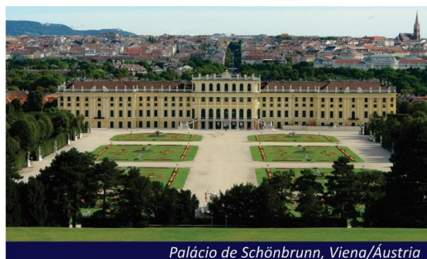
Palácio de Schönbrunn, Viena/Áustria