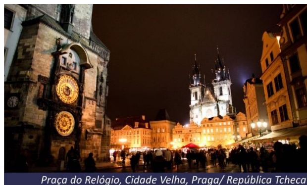
Praça do Relógio, Cidade Velha, Praga/ República Tcheca