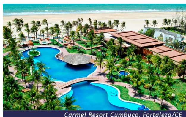
Carmel Resort Cumbuco, Fortaleza/CE

Café da manhã no hotel e dia livre. Sugerimos conhecer o Beach Park, um complexo turístico do litoral do Nordeste do Brasil, na praia de Porto das Dunas, município de Aquiraz, a 26 quilômetros de Fortaleza. Seu parque aquático é considerado o maior da América Latina, distribuído numa área total de 20.000 m 2 e 13 km 2 de área específica do Parque Aquático.