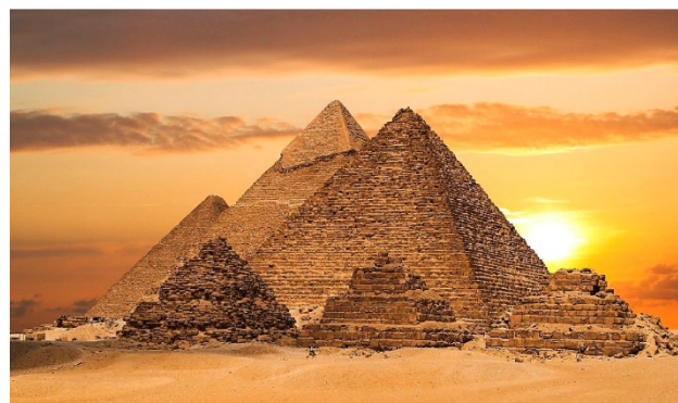
Pirâmides de Quéops, Quéfren e Miquerinos, Cairo/ Egito

Café da manhã no hotel e traslado ao aeroporto e embarque com destino a Luxor para início do Cruzeiro pelo Rio Nilo. Almoço incluído. Chegada, traslado e visita aos Grandes Templos de Karnak e Luxor. Logo após embarque em cruzeiro pelo Rio Nilo. Jantar a bordo. Sugerimos a escolha do passeio o show de luzes e som no Templo de Karnak.