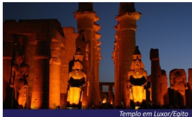
Templo em Luxor/Egito

antiga do Egito. Retornaremos ao Hotel. Sugerimos um jantar abordo de um magnífico Cruzeiro pelo Rio Nilo. Hospedagem.