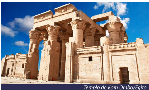
Templo de Kom Ombo/Egito

Pela manhã visita ao Grande Templo de Hórus, em Edfu, o melhor conservado Templo de todo o Egito, onde chegaremos em charmosas charretes. Visita ao Templo de Kom Ombo. Navegação até Aswan. Pensão completa a bordo.