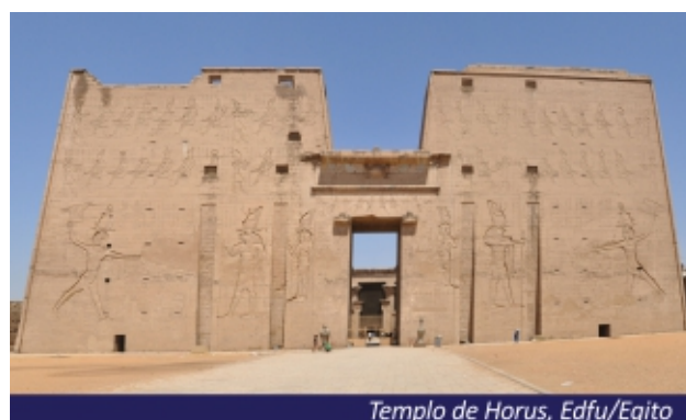
Templo de Horus, Edfu/Egito

Café da manhã, dia livre para passeios. Sugerimos visita a cidade de Alexandria que abriga o maior porto do Egito e um dos mais importantes do Oriente Médio. Veremos a Praça de Mansheya, a estátua em bronze de Mohamed Ali, o Monumento ao Soldado Desconhecido, as Catacumbas de Shawergafa, Forte de Qait Bey entre outros. Hospedagem.