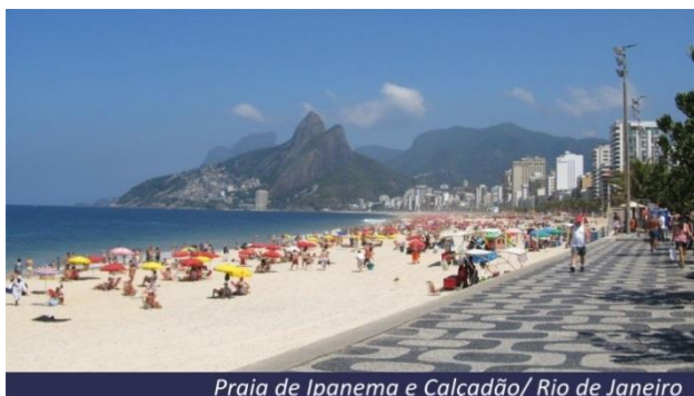
Praia de Ipanema e Calçada/ Rio de Janeiro

Traslado de chegada em regular do Aeroporto do Rio ao Hotel na Zona Sul da cidade.