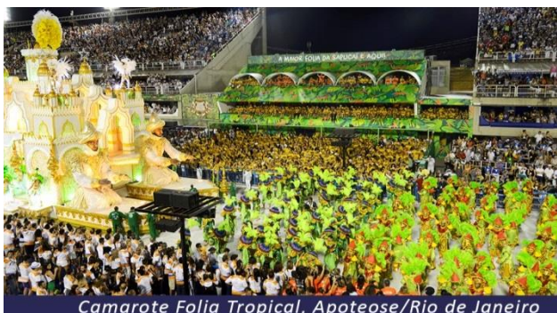
Camarote Folia Tropical, Apoteose/Rio de Janeiro