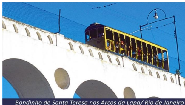
Bondinho de Santa Teresa nos Arcos da Lapa/ Rio de Janeiro

Café da manhã e dia livre para aproveitar a cidade. À noite assistiremos do Camarote Vip o desfile do grupo especial das Escolas de Samba do Rio de Janeiro, este fica no Setor 5 B Especial, é um andar totalmente privativo e EXCLUSIVO, localizado no lado ímpar, bem no meio da avenida, onde as escolas param para se exibir em frente ao módulo dos jurados. Uma área de 54.81 m2 tudo organizado pela Carnaval Turismo, empresa que atua no segmento de eventos e receptivo do Rio de Janeiro há 29 ANOS , Os camarotes dos Setores Especiais, são os únicos da Marquês de Sapucaí, com toilettes privativos dentro dos camarotes, além de recepção, área de cozinha, guarda volume e apoio de Buffet. Uma área restrita e privilegiada onde é oferecido Buffet com mesa de Frios, comida japonesa, jantares especiais com entrada, prato principal e sobremesa, open bar de Whisky 12 anos a vinhos importados. Pelo estilo, elegância e qualidade nos serviços , os camarotes da CARNAVAL TURISMO são considerados de altíssimo padrão na Marquês de Sapucaí.