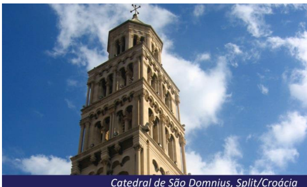
Catedral de São Domnius, Split/Croácia

segundo maior centro urbano da Croácia e a sede do Condado de Split e Dalmácia. É tradicionalmente considerado como tendo mais de 1.700 anos de idade. Desde 1979, o centro histórico de Split foi inscrito na Lista de Patrimônio Mundial da UNESCO. Os edifícios históricos e culturais estão localizados dentro das muralhas do Palácio de Diocleciano. Jantar livre e pernoite cidade histórica de Split.