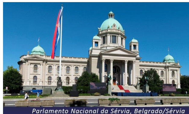
Parlamento Nacional da Sérvia, Belgrado/Sérvia

Após o café da manhã no hotel deixaremos a capital da Sérvia em direção à histórica capital da Bósnia e Herzegovina, Sarajevo. Chegada e hospedagem.