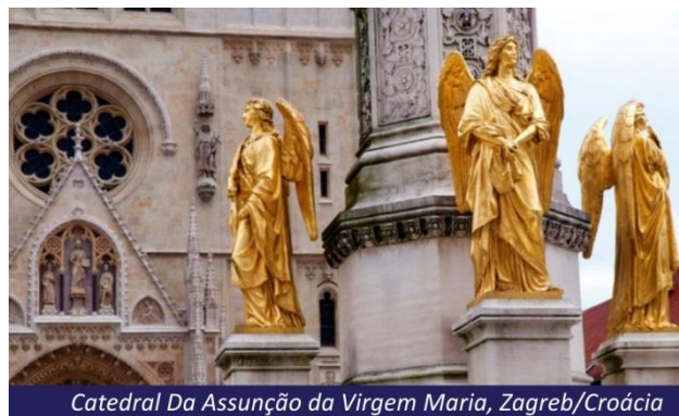
Catedral Da Assunção da Virgem Maria, Zagreb/Croácia

Café da manhã no hotel e visita à Zagreb, uma importante cidade da Europa Central. Durante o nosso tour pela alta Zagreb, veremos a Praça Bar Jelacic, o coração da cidade, a Catedral da Assunção da Virgem Maria, também conhecida como a Catedral de São Estevão, com afrescos do séc. XIII, e o Palácio Arcebispal. A continuação do nosso passeio será pela baixa Zagreb, bairro moderno e comercial, com seus diversos museus, galerias, agradáveis praças, centros culturais e comerciais. Tarde livre.