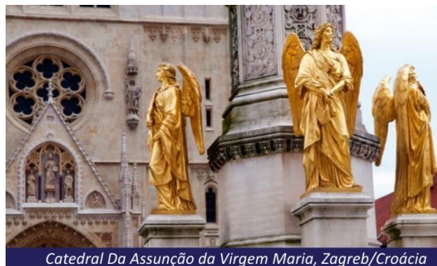
Catedral Da Assunção da Virgem Maria, Zagreb/Croácia

Café da manhã no hotel e visita à Zagreb, uma importante cidade da Europa Central. Durante o nosso tour pela alta Zagreb, veremos a Praça Bar Jelacic, o coração da cidade, a Catedral da Assunção da Virgem Maria, também conhecida como a Catedral de São Estevão, com afrescos do séc. XIII, e o Palácio Arcebispal. A continuação do nosso passeio será pela baixa Zagreb, bairro moderno e comercial, com seus diversos museus, galerias, agradáveis praças, centros culturais e comerciais. Tarde livre.