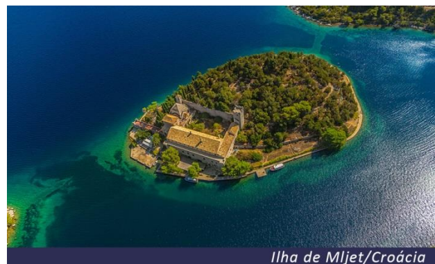
Ilha de Mljet/Croácia

permaneceram desde os tempos da antiga República de Dubrovnik (1358 a 1808). Seguiremos até a cidade velha para um passeio guiado desta cidade mágica, patrimônio universal da UNESCO e faremos uma parada em um dos mirantes de onde teremos uma espetacular vista das antigas muralhas e das ilhas de Elaphiti. Tempo livre para lazer e para almoçar na cidade antiga. À tarde, regresso ao late e início do nosso cruzeiro para a Ilha Šipan, onde ancoraremos em uma pequena e pitoresca vila de pescadores Šipanska Luka. Caso os horários das docas e da eclusa ou as condições climáticas nos impeçam de ancorar em Šipanska Luka, fazemos um cruzeiro para Slano, localizado no continente. Jantar a bordo (incluído) e pernoite em Šipanska Luka ou em Slano no continente.