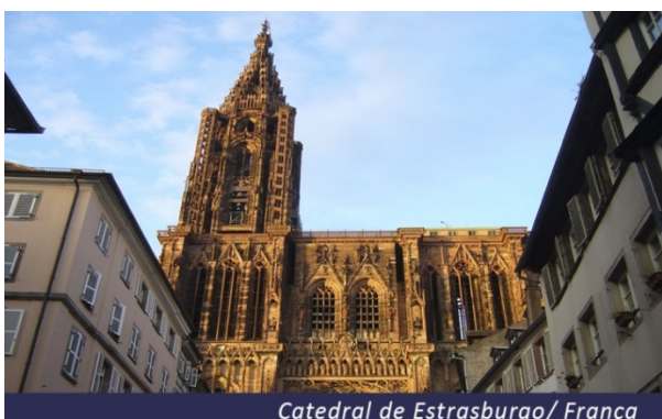
Catedral de Estrasburgo/ França

Após o café da manhã, sugerimos visita opcional de Estrasburgo. A linda cidade é a capital da região da Alsácia e desde 1998 sedia o Tribunal Europeu dos Direitos Humanos. Possui uma rica história e maravilhosa arquitetura, seu centro antigo é patrimônio mundial da UNESCO desde 1988. Vale destacar a visita à imponente Catedral de Notre Dame e o bairro Petit France. Após a visita, retorno ao navio para almoço. Tarde livre. Pensão completa a bordo.