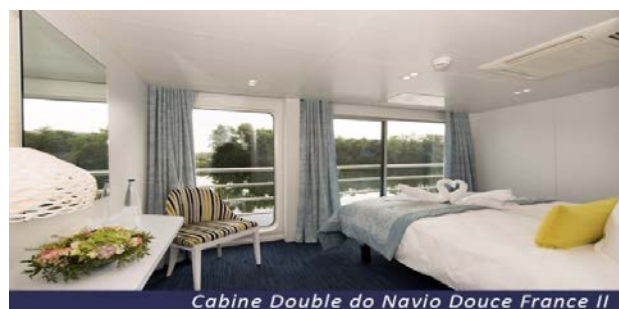
Cabine Double do Navio Douce France II

A região foi colonizada pelos celtas, sucedidos pelos romanos, alamanos e francos, cujas culturas deixaram vários sítios arqueológicos importantes nas redondezas. A povoação apareceu documentada pela primeira vez em 1074, e somente em 1818 recebeu status de cidade. Hoje é um ativo ponto turístico por devido a suas construções históricas, museus, festivais e centros de cultura, e tem grande produção de vinhos. Pensão completa a bordo.