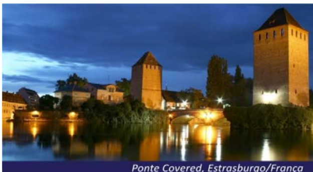
Ponte Covered, Estrasburgo/França

Aproveite o apaixonante passeio pela Alemanha, França, Holanda e Suíça.