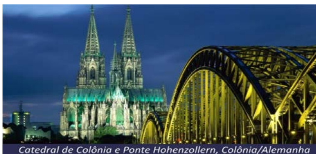
Catedral de Colônia e Ponte Hohenzollern, Colônia/Alemanha

Após o café da manhã, sugerimos excursão opcional em Dusseldorf e Colônia. Sendo a primeira, uma cidade histórica, com 700 anos e durante a visita panorâmica, conheceremos seu bairro histórico com suas belas igrejas dos séculos XII e XIII. Após ao almoço seguiremos nossa excursão para Colônia, onde se encontra um dos mais importantes portos fluviais da Alemanha e é considerada a capital urbana, econômica, cultural, administrativa e histórica da Renânia. Com mais de um milhão de habitantes, Colônia é a 4ª maior cidade alemã e a 16ª maior cidade da União Europeia em população. Esta cidade conta com a monumental catedral de Colônia que começou a ser construída em 1248, mas as obras só foram concluídas em 1880, na época era a construção mais alta do mundo, com torres de 157 metros de altura. Após a visita, retorno ao navio. À noite, início da navegação para Rudesheim. Pensão completa a bordo.