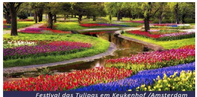
Festival das Tulipas em Keukenhof /Amsterdam

Café da manhã a bordo e saída para visita em Amsterdam (incluído). Fundada em 27 de outubro de 1275, a Capital Holandesa é hoje uma das mais importantes e belas cidades da Europa. Visita da cidade e seus arredores. Admire as belas casas do século XVII, charmosas igrejas e casas de mercadores do século XVI em uma excursão guiada, desfrute de um passeio através dos mais importantes pontos turísticos da cidade, incluindo uma parada para fotos no Moinho Rembrandt. Retorno ao barco para almoço. A tarde, saída para visita ao parque floral de KEUKENHOF o paraíso das tulipas. Retorno a bordo e início de nossa navegação.