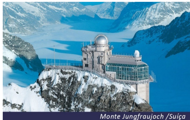
Monte Jungfrauoch / Suíça

Café da manhã no hotel, e dia livre para aproveitar as maravilhas desta bela cidade. Sugerimos visita opcional ao Monte Jungfrauoch, considerado Patrimônio Natural da UNESCO e a estação ferroviária mais alta da Europa. Uma das experiências mais incríveis pelo país, com um complexo turístico de alto padrão onde podemos desfrutar de restaurantes, um palácio de gelo e até uma loja do chocolate Lindt. Recomendamos tirar o dia inteiro para realizar este passeio. Hospedagem.