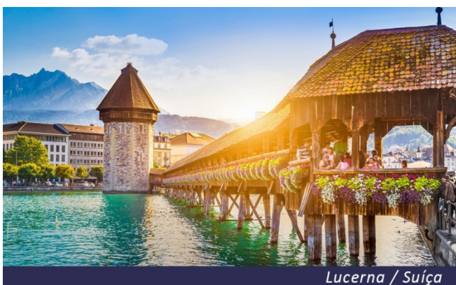
Lucerna / Suíça

Café da manhã no hotel e saída para visitar a encantadora cidade de Lucerna. Faremos um agradável passeio a pé para desfrutarmos desta bela cidade, conhecida por ser a porta de entrada da Suíça Central com as suas atrações, como o belíssimo lago com a famosa Ponte de Madeira, considerado o cartão postal da cidade, as lindas Igrejas, antigas praças e edifícios monumentais. Retorno a Zurique e hospedagem.