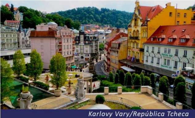
Karlovy Vary/República Tcheca

mundialmente famoso pelos seus cristais de alta qualidade e pureza. A rainha da Inglaterra, Elisabeth II e o Rei Juan Carlos da Espanha são clientes fiéis dos cristais produzidos em Kalovy Vary. Pensão completa a bordo.