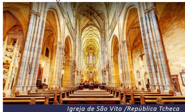
Igreja de São Vito /República Tcheca

Você também verá a Catedral de São Vito, maior edifício religioso do país e uma das mais prestigiosas catedrais góticas da Europa, o antigo Palácio Real e a Igreja do Menino Jesus de Praga. O passeio continua na Cidade Antiga, “Stare Mesto”, cujo distrito tem sua origem a mais de 1000 anos, é um dos principais locais históricos da Boêmia. Ao caminhar pelas ruas estreitas da cidade, você descobre o bairro judeu, a Prefeitura, o seu famoso relógio astronômico e a igreja de Nossa Senhora de Týn. Embarque às 18:00 e acomodação nas cabines. Apresentação da tripulação, coquetel de boas vindas e jantar. Pernoite a bordo em Praga.