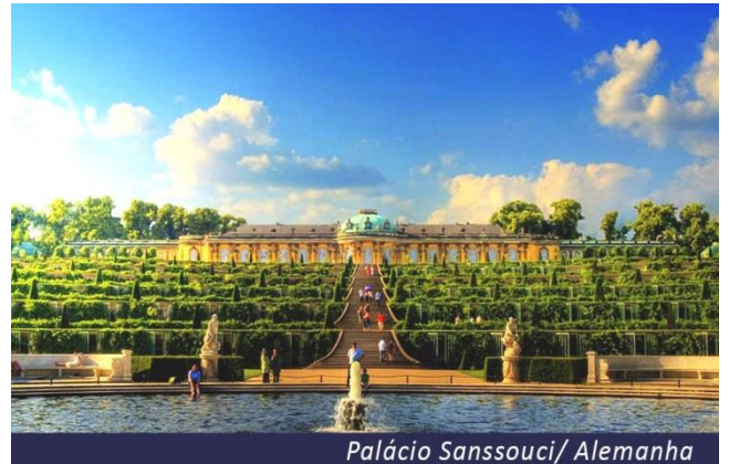
Palácio Sanssouci/ Alemanha

Traslado ao hotel e tour opcional aos jardins do Palácio Sanssouci, magnífico parque de belos jardins projetados durante o reinado de Frederico, o Grande. Hospedagem