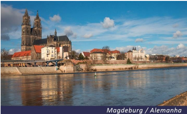
Magdeburg / Alemanha

UNESCO. Tarde de navegação. Noite de Entretenimento a bordo. Pensão completa.