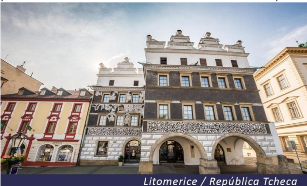
Litomerice / República Tcheca

Manhã de navegação para Horin, momento perfeito para admirar a paisagem ou participar da animação a bordo. A tarde, visita guiada de Litomerice, cidade real, uma das mais antigas da Boêmia, fundada no século XIII e cuja cidade velha foi declarada monumento histórico, patrimônio da UNESCO. As casas com arcadas dispostas ao redor da praça central, as numerosas igrejas típicas e outras galerias, são uma grande fonte de informação sobre suas vicissitudes históricas. Regresso a bordo. Navegação para Litomerice. Pensão completa.