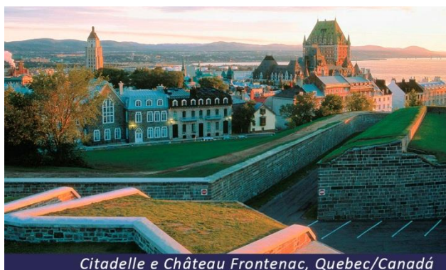
Citadelle e Château Frontenac, Quebec/Canadá

Após nosso café da manhã seguiremos rumo a histórica cidade de Quebec, a mais antiga do Canadá e declarada pela UNESCO como Patrimônio Cultural da Humanidade. Ao chegarmos, faremos um passeio pelos principais pontos de interesse como a Praça das Armas, Praça Real, Bairro Petit Champlain, Parlamento de Québec, Terraço Dufferin, Château Frontenac, Ruas Saint-Jean e Grande-Allée e Vieux-Port. Ao final do dia teremos tempo livre para caminharmos pelo Centro Histórico, ainda hoje cercado por muralhas, e para desfrutar dos muitos cafés e restaurantes locais. Pernoite em Quebec.