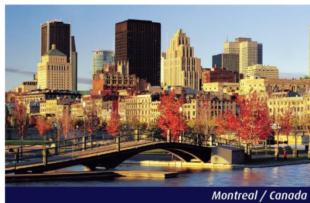
Montreal / Canada

faremos um city tour passando pela Velha Montreal, Basílica de Notre-Dame (entrada não-inclusa), cidade subterrânea, Boulevard Saint-Laurent, Rue Saint-Denis e ao Mount Royal, montanha que deu nome à cidade. Final de tarde livre para desfrutar do clima cosmopolita e jovial da cidade. Pernoite em Montreal.