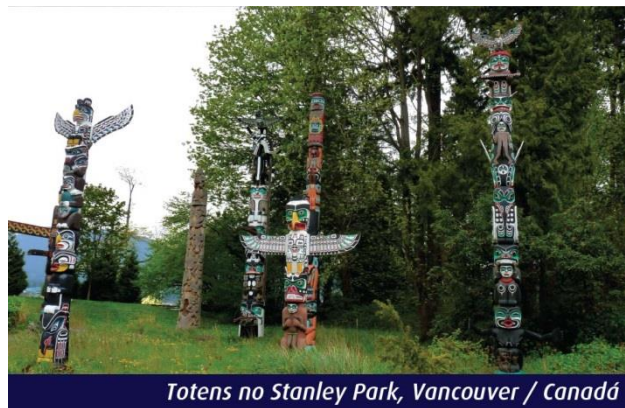
Totens no Stanley Park, Vancouver / Canadá

Continuação do roteiro, entrando nos territórios da Colúmbia Britânica, passando aos pés do Mount Robson, a mais proeminente e mais alta das Montanhas Rochosas da América do Norte. Seguimos a viagem até chegar em Kamloops. Pernoite em Kamloops.