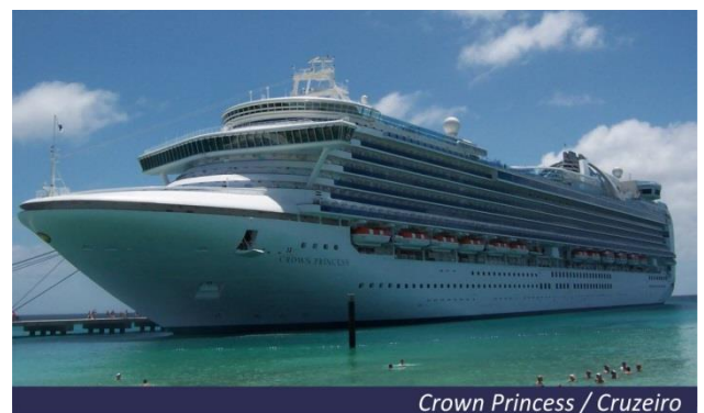
Crown Princess / Cruzeiro

De uma posição estratégica invejável, uma fartura de recursos marinhos e naturais extraordinária, um clima muito suave em relação à vizinha Inglaterra e nenhum imposto adicional cobrado. Os habitantes das ilhas do canal das quais Guernsey e Jersey fazem parte podem, realmente, sentir-se muito satisfeitos. A sua história e tradição antiga garantem, já há quase oitocentos anos, a todos os habitantes deste arquipélago inglês em terra "quase" francesa alguns privilégios invejados por todos os súditos da Grã-Bretanha. Chegada na parte da manhã e partida a tarde. Pensão completa a bordo.