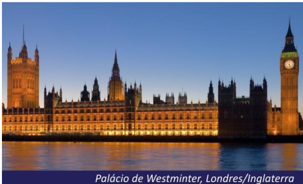
Palácio de Westminster, Londres/Inglaterra

Após o café da manhã, desembarque do navio e saída para a estação ferroviária para embarque no trem de alta velocidade EUROSTAR com destino a Paris. Chegada e hospedagem. Restante do dia livre para atividades independentes.