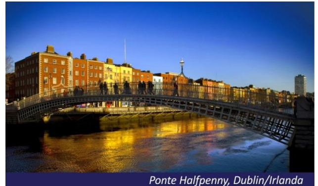
Ponte Halfpenny, Dublin/Irlanda

Pensão completa a bordo. Excelente momento para aproveitar os entretenimentos a bordo e conforto do seu transatlântico.