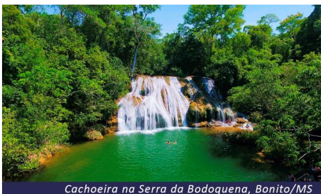
Cachoeira na Serra da Bodoquena, Bonito/MS

Café da manhã no hotel e dia livre para aproveitar a cidade de rios de águas transparentes, cachoeiras, grutas e cavernas. Fauna e flora exuberantes, com centenas de espécies de aves, mamíferos e répteis ocupando uma vegetação que mistura o Cerrado com a Mata Atlântica. Jantar no hotel e Hospedagem.