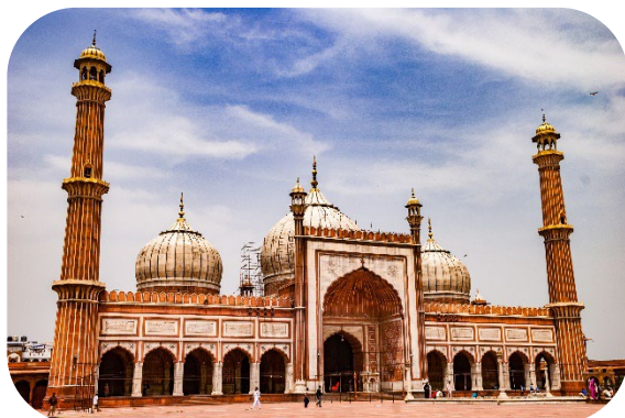
Mesquita Jama Masjid

Café da manhã no hotel e em horário adequado, traslado ao aeroporto para embarque em classe econômica em voo com destino a Nova Delhi. Chegada à capital indiana e traslado ao hotel para hospedagem.