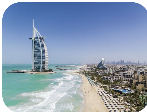
Torre Burj al Arab