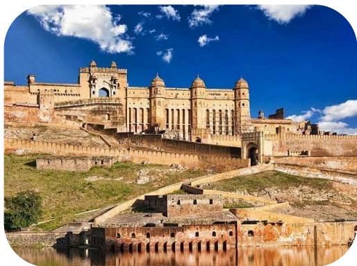
Mesquita Jama Masjid

Café da manhã e saída para o city-tour visitando o Forte Amber, um palácio clássico do Rajastão. Uma das principais atrações de Amber é o passeio de elefante até a entrada do forte. Passagem pelo Jal Mahal, maravilhosamente restaurado, um pavilhão real e na parte da tarde, city-tour visitando o Palácio da Cidade de Maharaja, o Palácio dos Ventos, um marco proeminente, e o observatório astronômico Jantar Mantar. Restante do tempo livre após o passeio, ideal para compras nos exóticos “bazares” locais. Hospedagem.