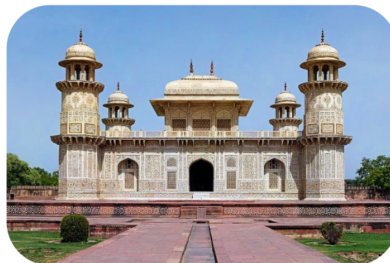
Tumba de Itmad-ud-Daulah