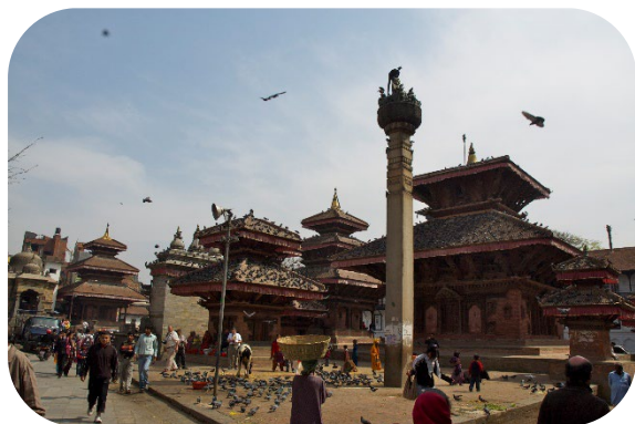
Templo da Deusa Viva

Café da manhã e saída em direção a Bhaktapur, uma das antigas capitais do Nepal, seguindo para os templos de Pashupatinath e Boudhanath, Retorno ao hotel em Kathmandu após as visitas para hospedagem.