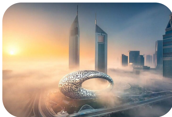
Museu do Futuro