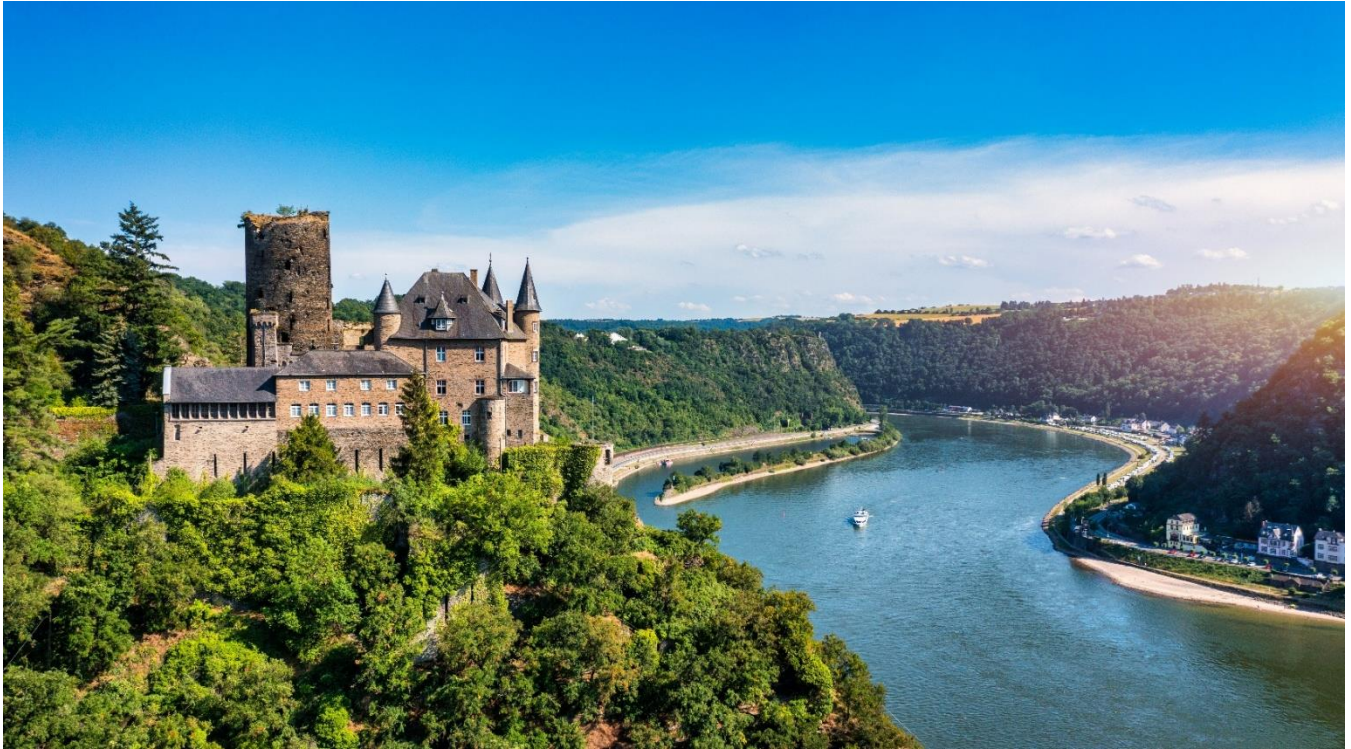
Rota Romântica do Rio Reno