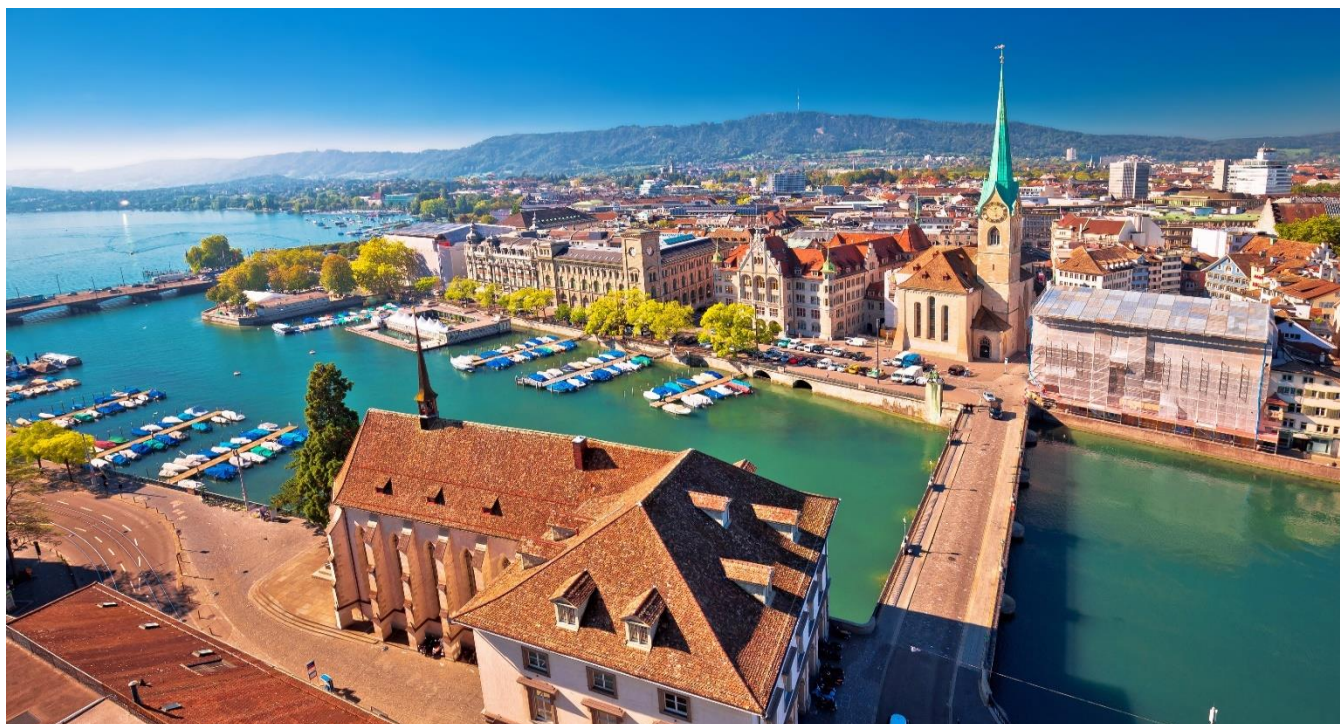
Margem do rio Zurique e Limmat

Café da manhã no hotel. Começaremos a visita explorando o centro histórico de Zurique, onde ruas estreitas e praças encantadoras revelam séculos de história. Passeie pelo Limmatquai, à beira do rio Limmat, e admire as fachadas medievais das casas e as pequenas lojas de artesanato. Visite a imponente Catedral Grossmünster, símbolo da cidade, conhecida por suas torres gêmeas e pelos vitrais de Marc Chagall. Em seguida, caminhe até a Bahnhofstrasse, uma das ruas comerciais mais famosas do planeta, ideal para observar a vida urbana, vitrines de marcas suíças de relógios e boutiques de luxo. Termine seu passeio na Lindenhof, um mirante tranquilo que oferece belas vistas sobre o centro histórico e o rio, perfeito para fotos e para sentir o charme de Zurique. Tarde livre. Hospedagem.