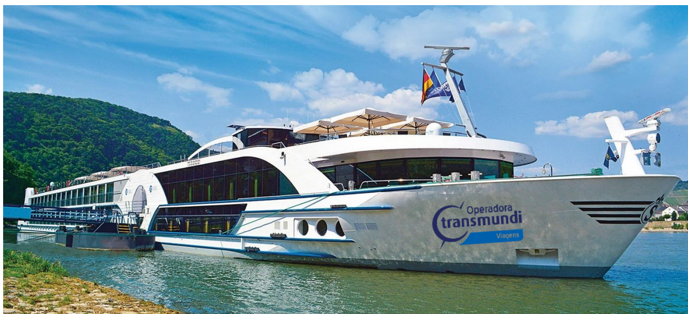
MS Viva Moments

Recepção e traslado ao porto para embarque no majestoso navio MS Viva Moments. Apresentação da tripulação e coquetel de boas-vindas. Jantar a bordo.