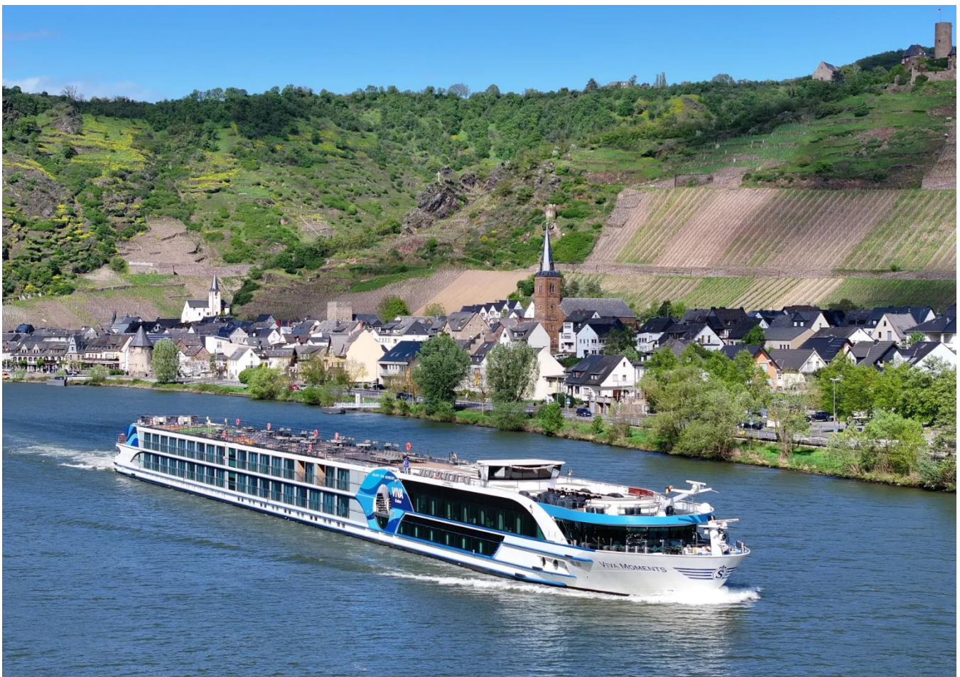
Vale Encanado do Rio Reno