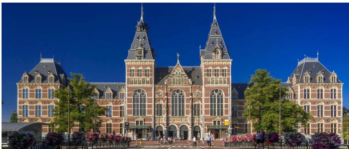
Rijksmuseum - um dos mais importantes museus de arte da Europa