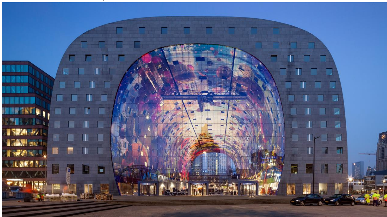
Markthal, em Rotterdam

Café da manhã a bordo. Explore a moderna Rotterdam, onde a ousadia arquitetônica e vida cotidiana se misturam. Entre os destaques estão a Ponte Erasmus, as inovadoras Casas Cubo e o impressionante Markthal, com sua fachada de vidro e teto mural colorido. Dentro do mercado, sabores variados revelam a diversidade culinária da cidade, que você poderá experimentar em pequenas degustações. Uma caminhada que celebra design visionário e cultura gastronômica. Retorno a bordo e almoço. Tarde livre para explorar a cidade de Rotterdam. Pensão completa a bordo.