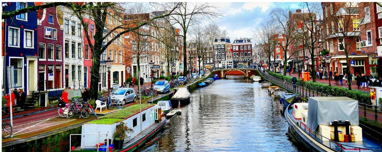
Canal em Amsterdam

Navegação noturna em direção a Amsterdam. A caminho do renomado Rijksmuseum, você terá uma primeira impressão da vibrante diversidade da famosa Capital dos Países Baixos, passando pelos canais típicos, fachadas históricas e bairros modernos. A arquitetura e a atmosfera únicas da cidade se revelam diante de seus olhos enquanto você percorre a capital holandesa. No Rijksmuseum, um dos mais importantes museus de arte da Europa, inicia-se uma fascinante viagem pelo patrimônio artístico dos Países Baixos. O ponto central da visita é a Galeria de Honra, que abriga obras-primas da Era de Ouro holandesa, incluindo pinturas de Rembrandt, Vermeer, Frans Hals e outros mestres. Entre os destaques está a icônica Ronda Noturna, de Rembrandt, assim como as meticulosas cenas interiores de Vermeer. Além das pinturas, o museu apresenta esculturas, mobiliário e artes decorativas que ilustram séculos da história cultural holandesa. Uma excursão inspiradora para quem deseja vivenciar arte e história em um dos cenários museológicos mais excepcionais da Europa. Retorno a bordo e almoço. Tarde livre para explorar a cidade de Amsterdam. Pensão Completa a bordo.