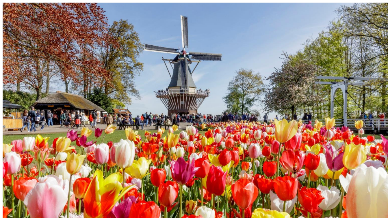
Jardins de Keukenhof com moinho ao fundo