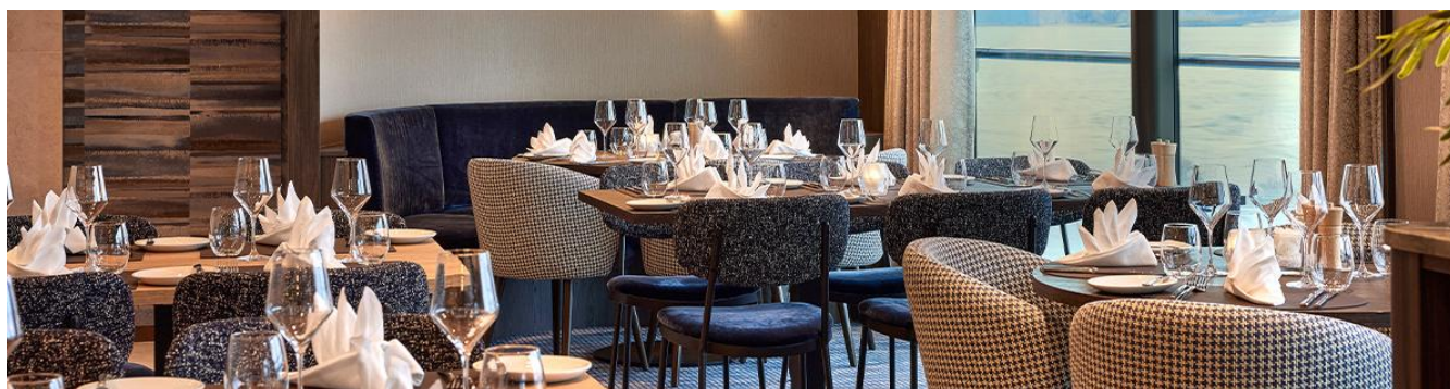
Elegante embarcação MS Viva Two