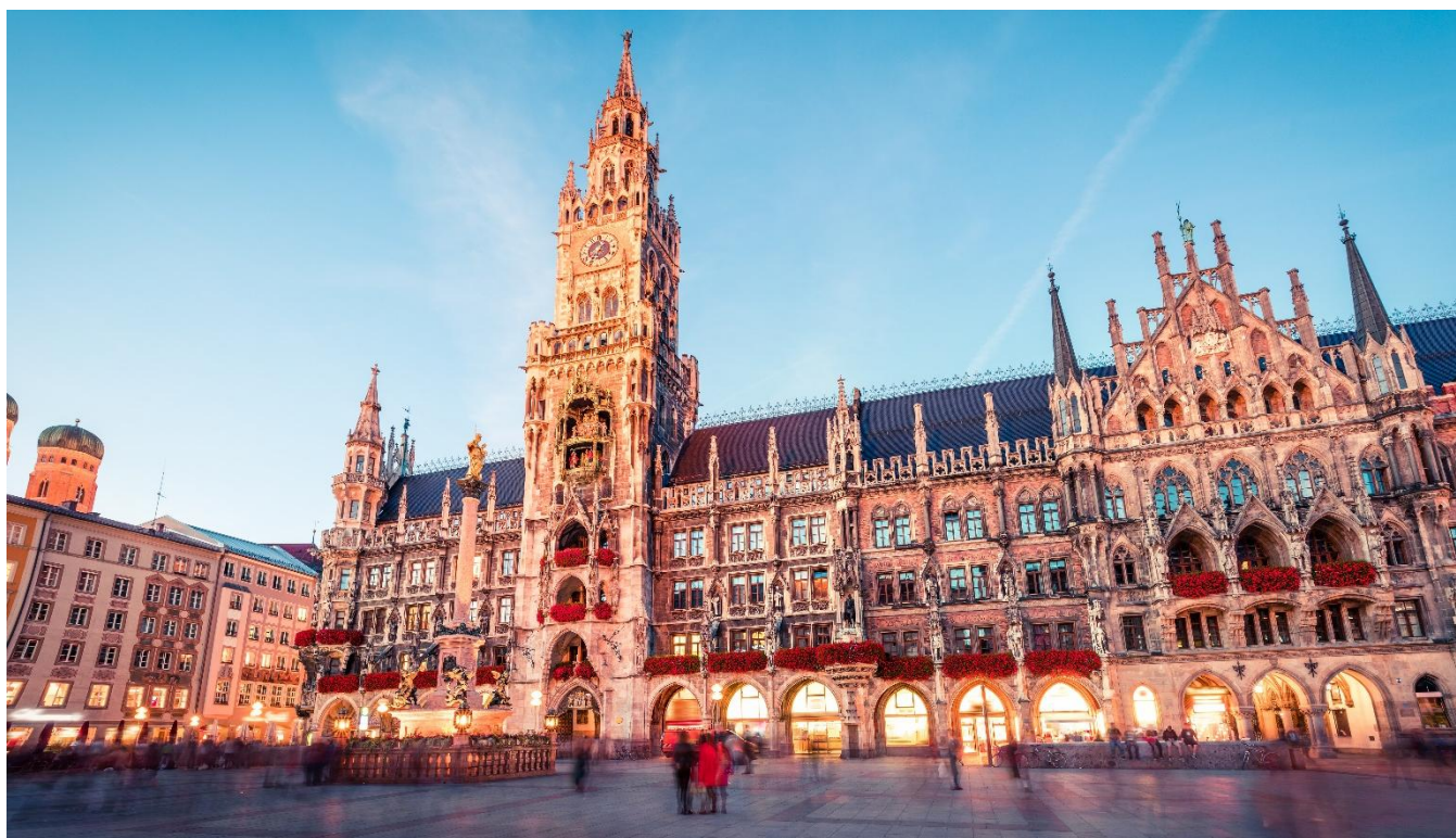
Marienplatz, a praça central de Munique, na Alemanha