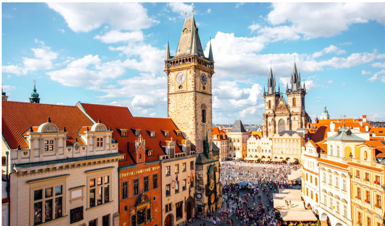
Cidade antiga de Praga, República Tcheca

Café da manhã no hotel. Dia dedicado à visita da cidade antiga de Praga e ao bairro do Castelo. Palácios, igrejas e conventos cercam em harmonia e dominam a capital da República Tcheca.