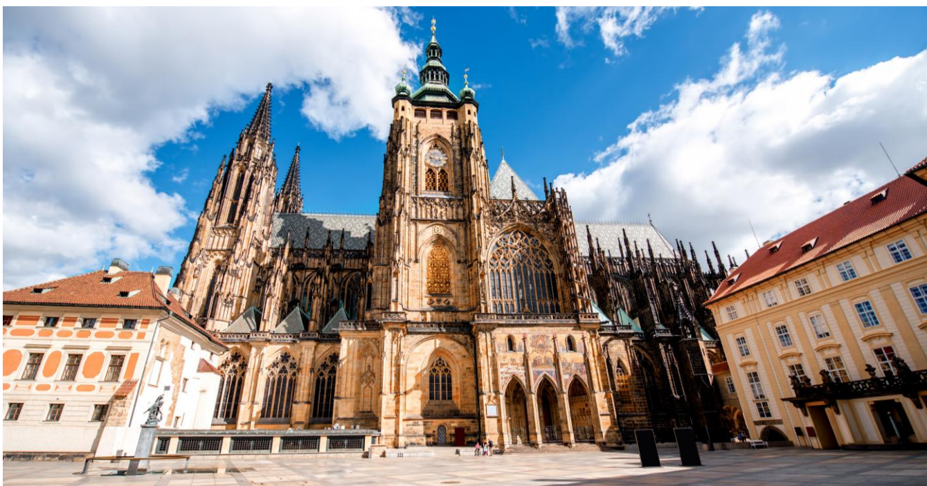
Catedral de São Vito, Cidade antiga de Praga, República Tcheca