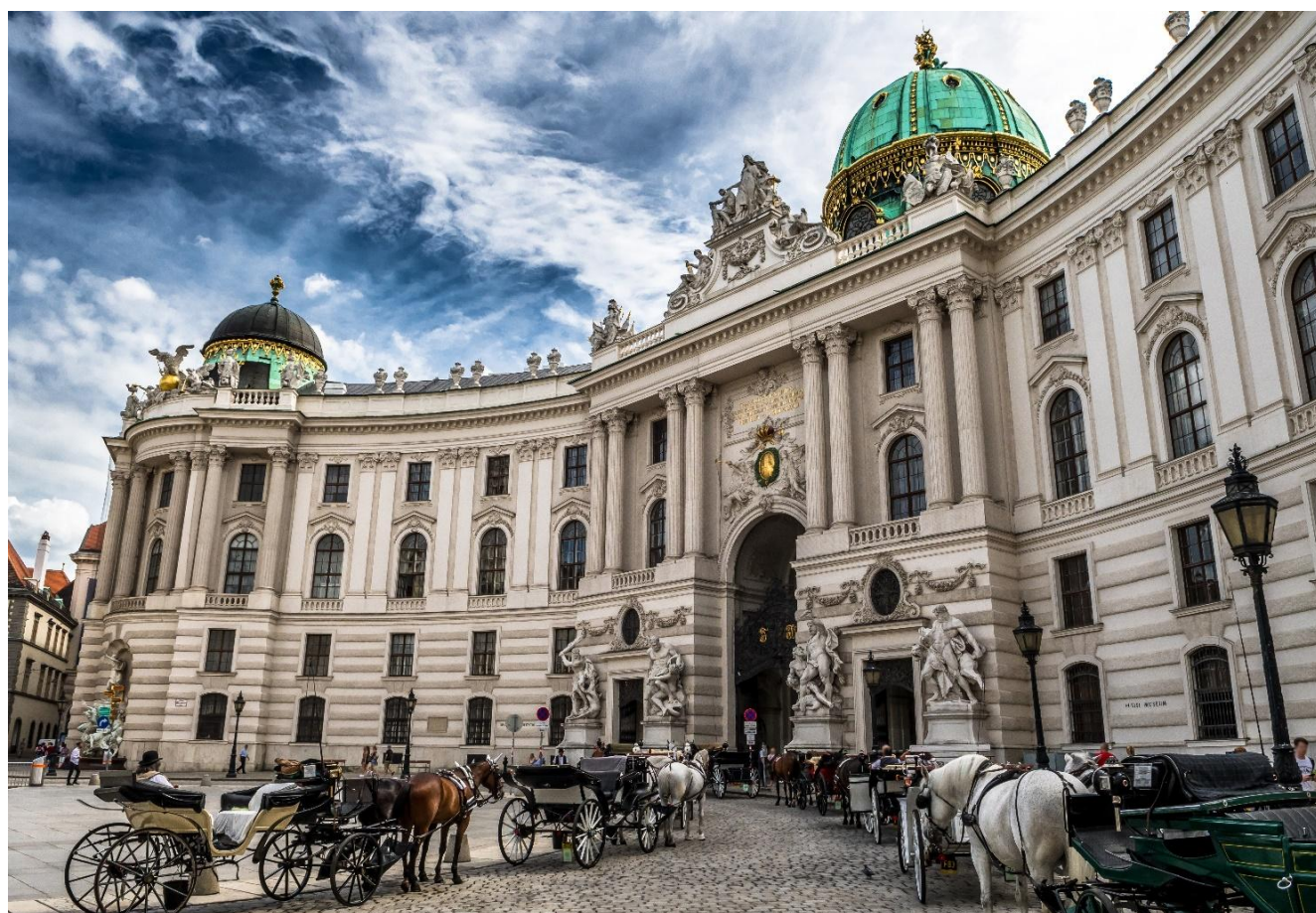
Palácio Hofburg, Viena, Áustria

Café da manhã a bordo. Dia dedicado à visita da cidade de Viena. A capital da Áustria, Viena, é uma cidade de superlativos e encanta todos os visitantes. Nesta visita, você descobrirá os marcos históricos mais importantes da cidade. Começamos com um passeio pela famosa Ringstrasse, onde admiramos os seus impressionantes edifícios, incluindo a Ópera Estatal, o Museu de História da Arte, o Museu de História Natural, bem como o Palácio Hofburg, o Parlamento, a Prefeitura, a Universidade e a Bolsa de Valores.