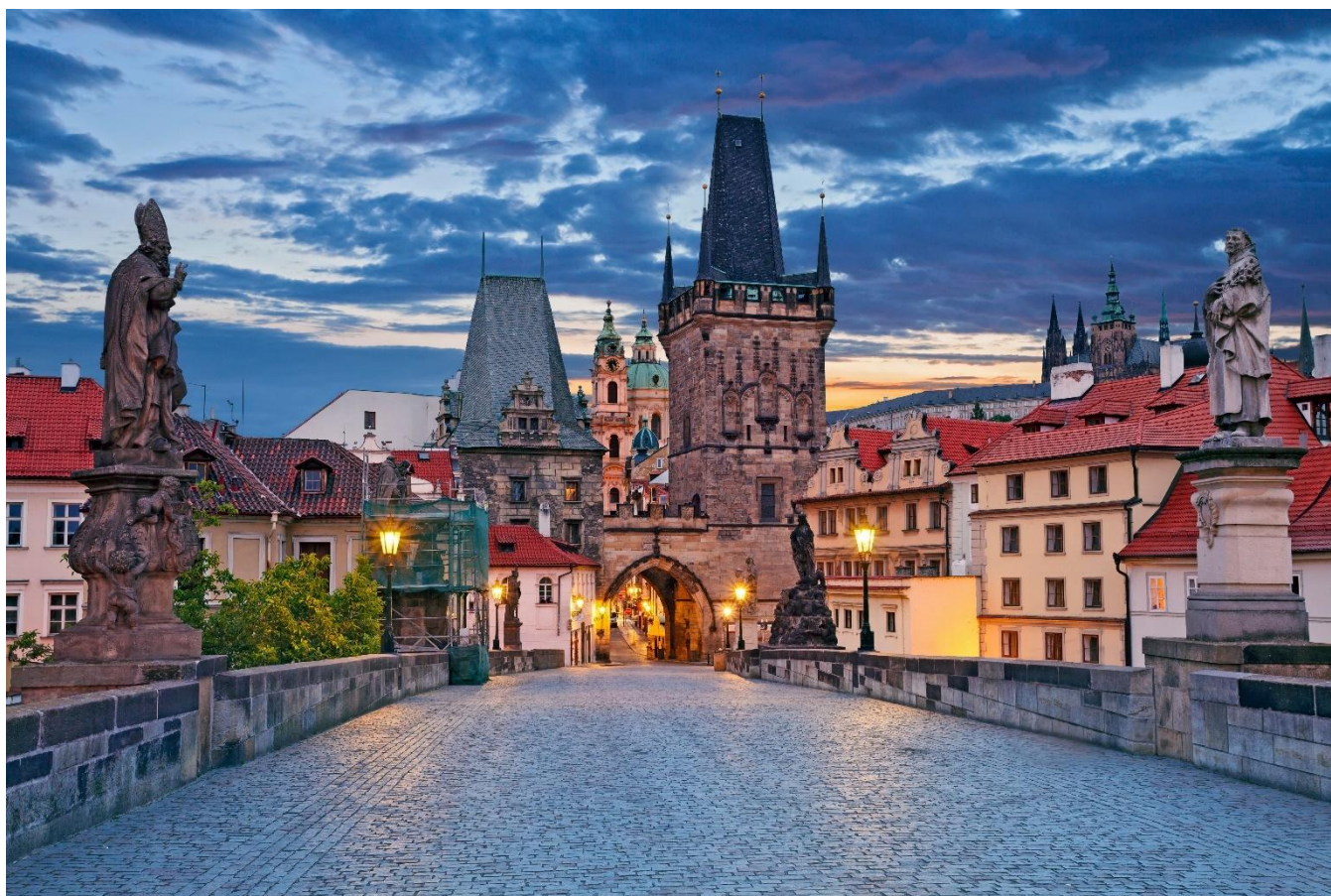
Ponte Carlos, Praga, República Tcheca

Você também verá a Catedral de São Vito, maior edifício religioso do país e uma das mais prestigiosas catedrais góticas da Europa, o antigo Palácio Real e a Igreja do Menino Jesus de Praga. O passeio continua na Cidade Antiga, “Stare Mesto”, cujo distrito tem sua origem a mais de 1.000 anos, e é um dos principais locais históricos da Boêmia. Ao caminhar pelas ruas estreitas da cidade, você descobre a famosa Ponte Carlos, o bairro judeu, a Prefeitura, seu famoso relógio astronômico e a belíssima Igreja de Nossa Senhora de Týn. Hospedagem.