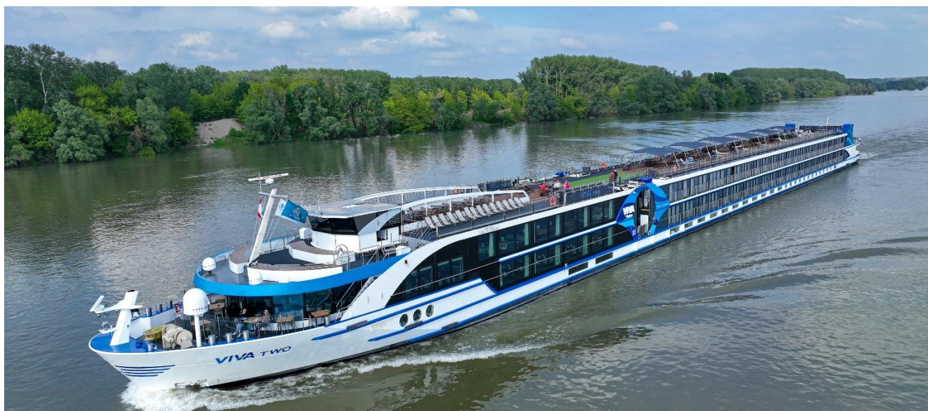
Elegante embarcação MS Viva Two

Café da manhã no hotel e saída para Passau, onde nos espera nosso luxuoso navio. Coquetel de boas-vindas, apresentação da tripulação e jantar a bordo.