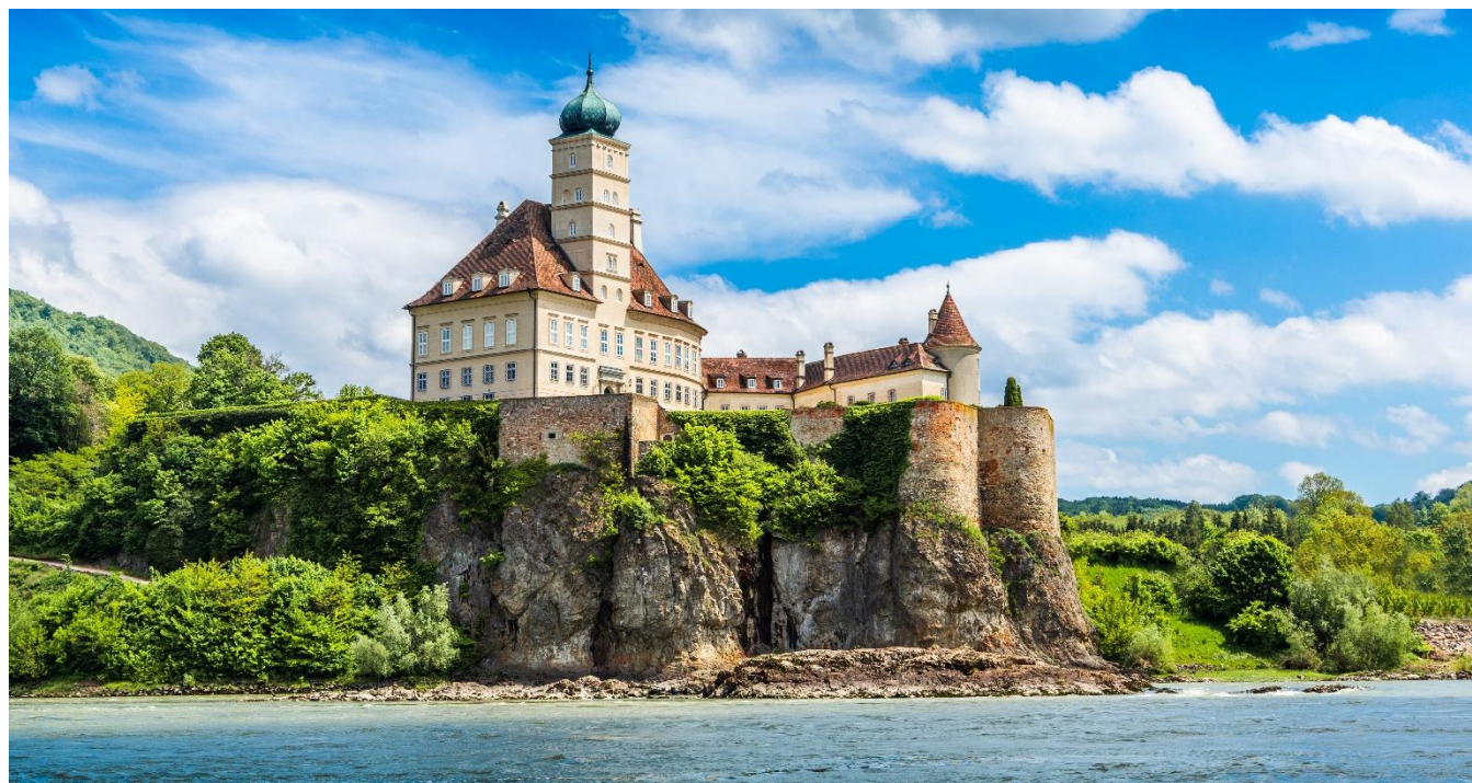
Abadia de Melk, Áustria

Café da manhã a bordo. Dia dedicado à visita a cidade de Melk. Ela é a porta de entrada para o Vale do Wachau. Qualquer pessoa que se aproxime dessa cidade histórica no Danúbio descobrirá a Abadia de Melk situada no alto com uma esplendida visão desde o Rio. A abadia faz parte do Patrimônio Mundial da UNESCO e merece uma visita. O impressionante conjunto barroco tem sido cuidado pelos monges da ordem beneditina desde o ano de 1.089. Cultura, fé e ciência unem-se nas magníficas salas do mosteiro. Hospedagem a bordo.