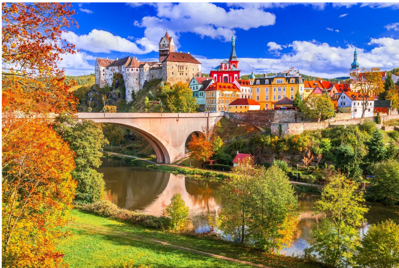
Karlovy Vary, Praga, República Tcheca