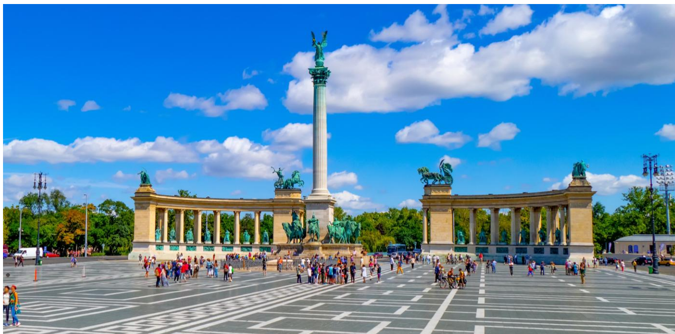
Praça dos Heróis, Budapeste, Hungria

Enquanto percorremos a elegante Avenida Andrassy, você passará por tesouros arquitetônicos como a Ópera Estatal e vislumbrará a vida local no movimentado centro da cidade e ao longo do Grande Boulevard. Atravessando para o lado pitoresco de Buda, desfrute de um passeio panorâmico com vistas deslumbrantes do Danúbio e suas icônicas