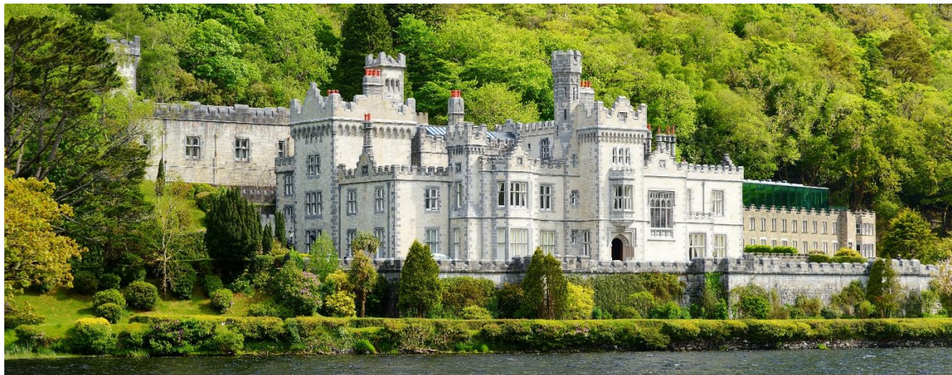
Abadia de Kylemore, Irlanda do Norte

Café da manhã no hotel e partida rumo à República da Irlanda, com visita à romântica Abadia de Kylemore, conhecida como o “Taj Mahal irlandês”. Prosseguimento por belas paisagens até Galway, a animada “cidade das tribos”. Hospedagem.