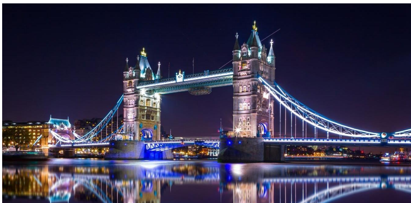
Tower Bridge em Londres, Inglaterra

Chegada à capital britânica, recepção e traslado ao hotel. Encontro com o seu Guia às 19h30 no saguão. Noite livre. Hospedagem.