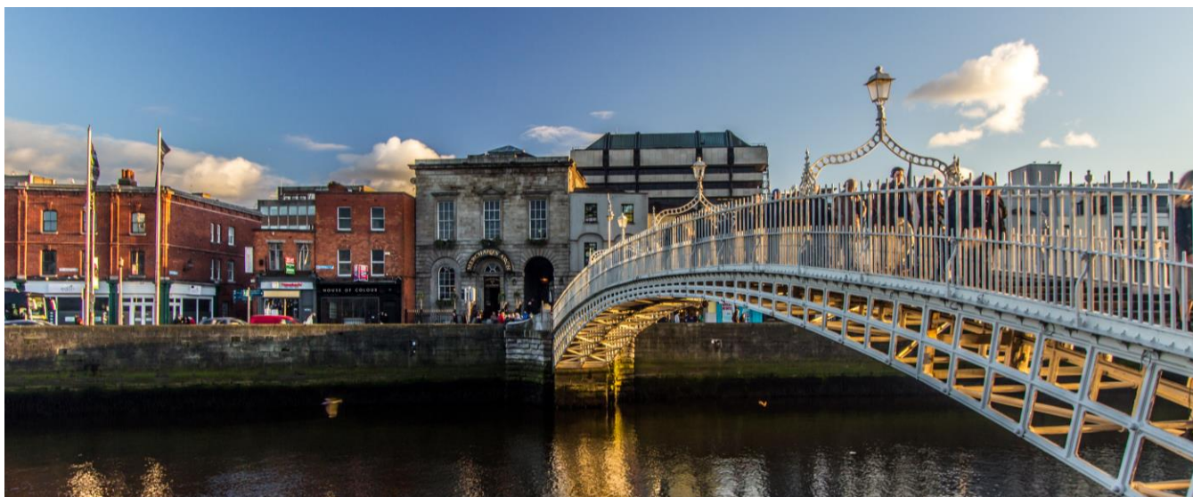
Ponte Ha'penny em Dublin, Irlanda

Café da manhã no hotel e visita panorâmica por Dublin, conhecendo sua história, lendas e principais monumentos.