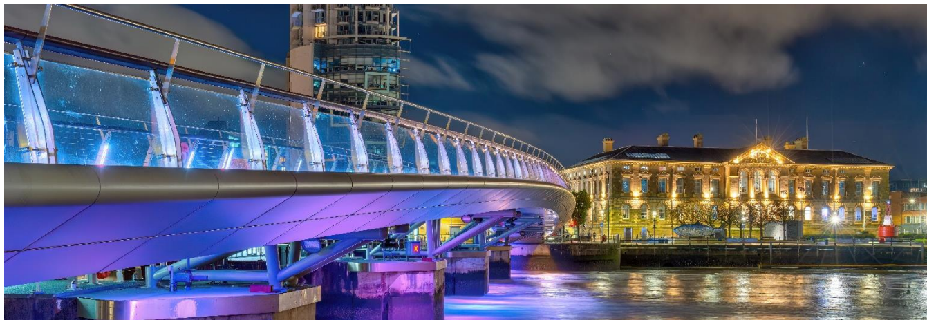
Belfast, Irlanda do Norte

Café da manhã no hotel e visita panorâmica a Belfast, explorando seus bairros, murais, Queen's University e os estaleiros do Titanic. À tarde, excursão até a famosa Calçada dos Gigantes, Patrimônio da UNESCO. Retorno a Belfast. Hospedagem.