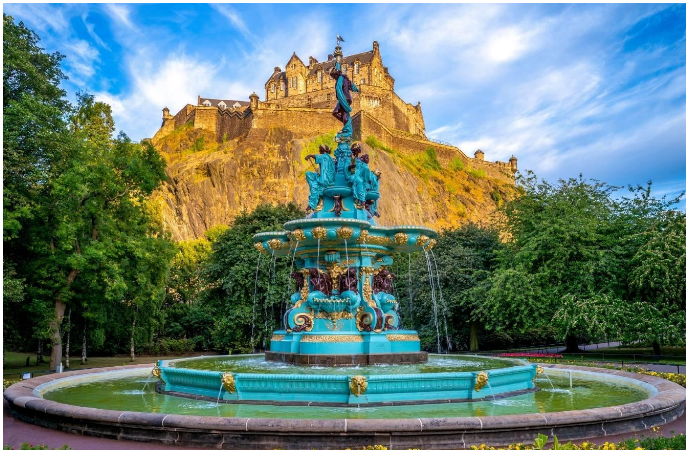
Castelo de Edimburgo, Escócia

Visita às ruas subterrâneas do Mary King's Close e ao imponente Castelo de Edimburgo. Encerraremos com a experiência interativa “Scotch Whisky Experience”. Hospedagem.