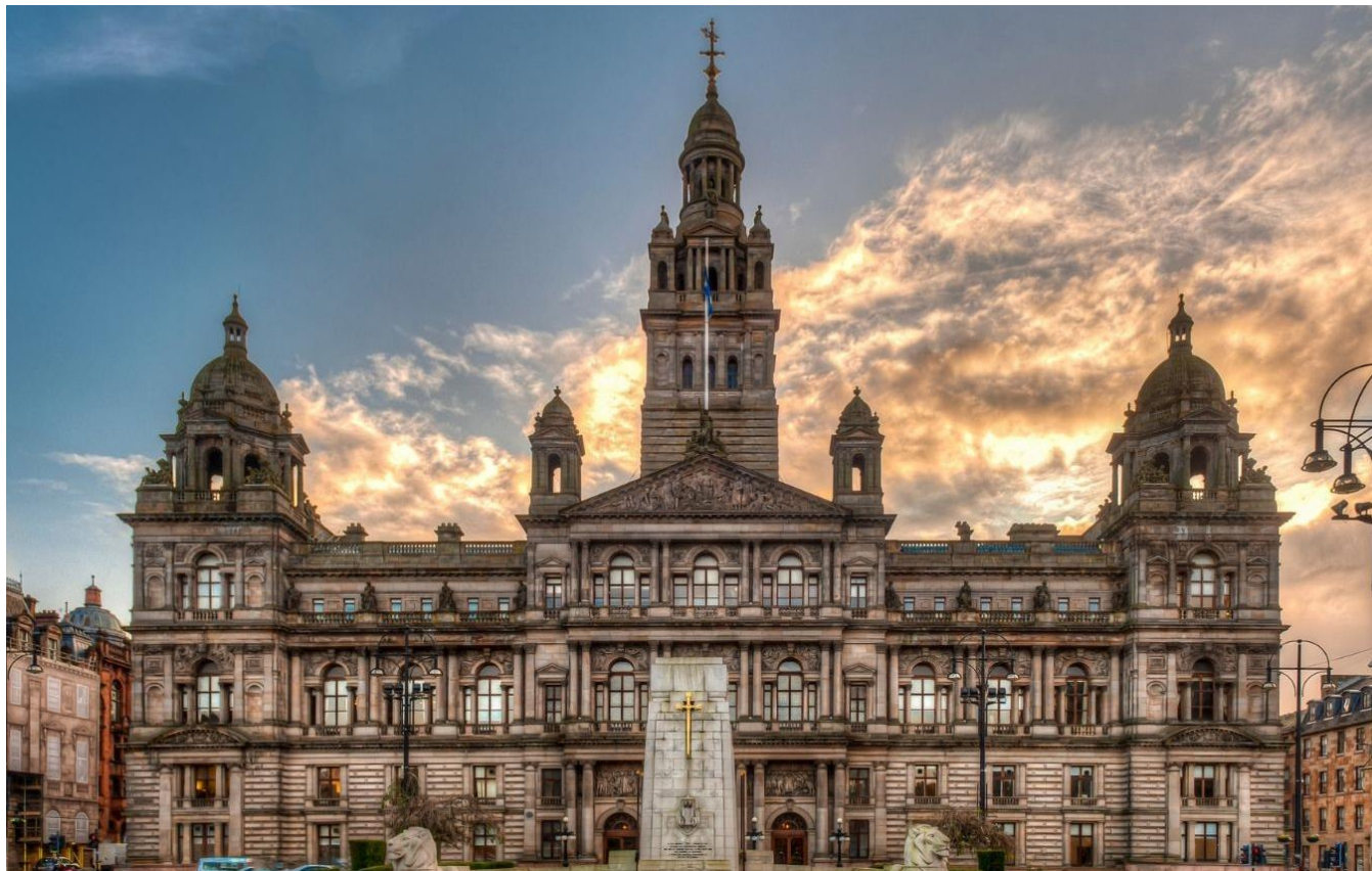
George Square de Glasgow, Escócia

Café da manhã no hotel e visita guiada da cidade de Glasgow, incluindo George Square, Catedral, Universidade e o Rio Clyde. À tarde, traslado até Cairnryan e travessia em ferry boat para Belfast, na Irlanda do Norte. Hospedagem.