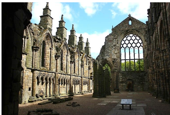
Palácio de Holyrood, Edimburgo, Escócia

Café da manhã no hotel e saída para city tour por Edimburgo, passando pelo Palácio de Holyrood, Catedral de St. Giles e a Royal Mile.