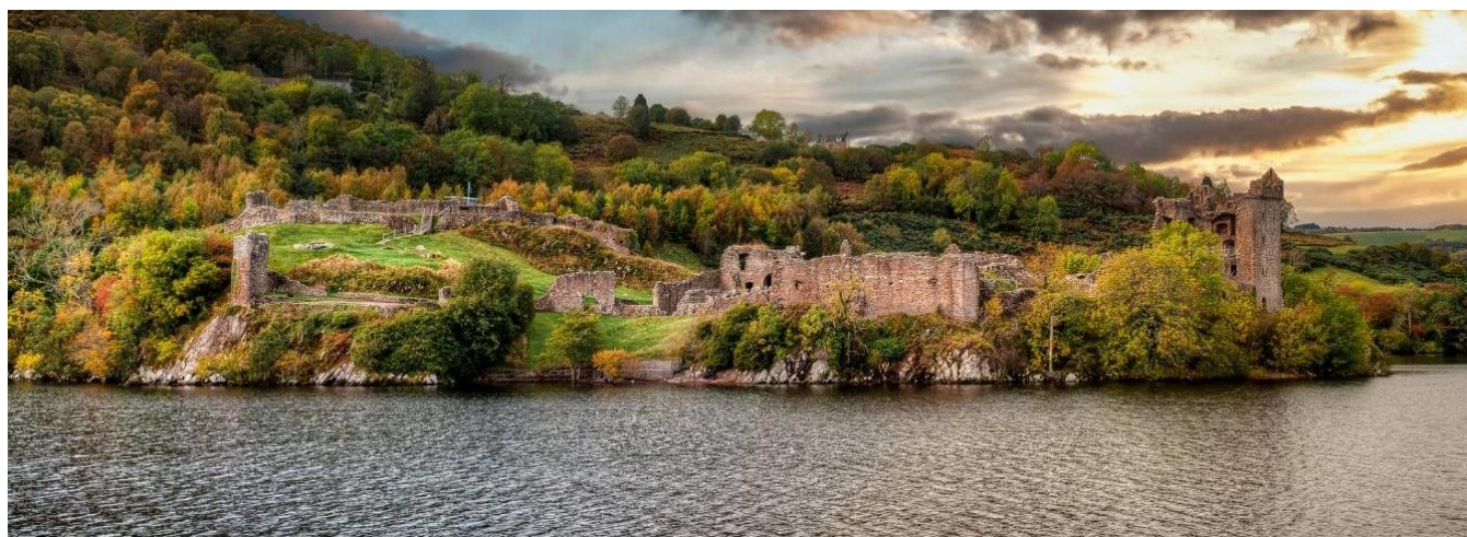
Lago Ness, Escócia

Café da manhã no hotel e saída para as Highlands: visita a Inverness, passeio de barco pelo Lago Ness com parada no Castelo de Urquhart, passagem por Fort Augustus, Fort William e o vale de Glen Coe. Finalizaremos o dia em Glasgow. Hospedagem.