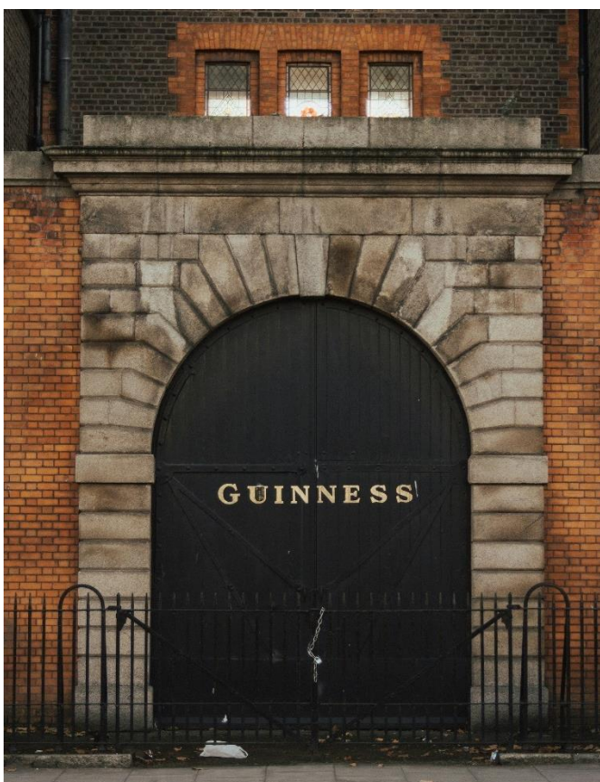
Guinness Storehouse, Irlanda

Encerraremos com a Guinness Storehouse, onde será possível conhecer o processo de fabricação e degustar a famosa cerveja. Retorno ao hotel para hospedagem.