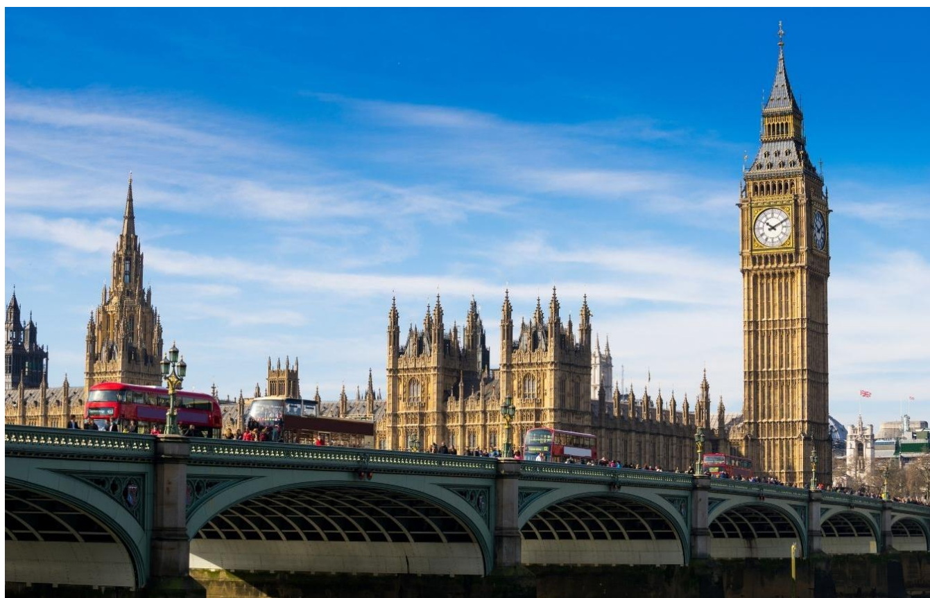
Big Ben, grande sino instalado na torre noroeste do Palácio de Westminster em Londres, Inglaterra