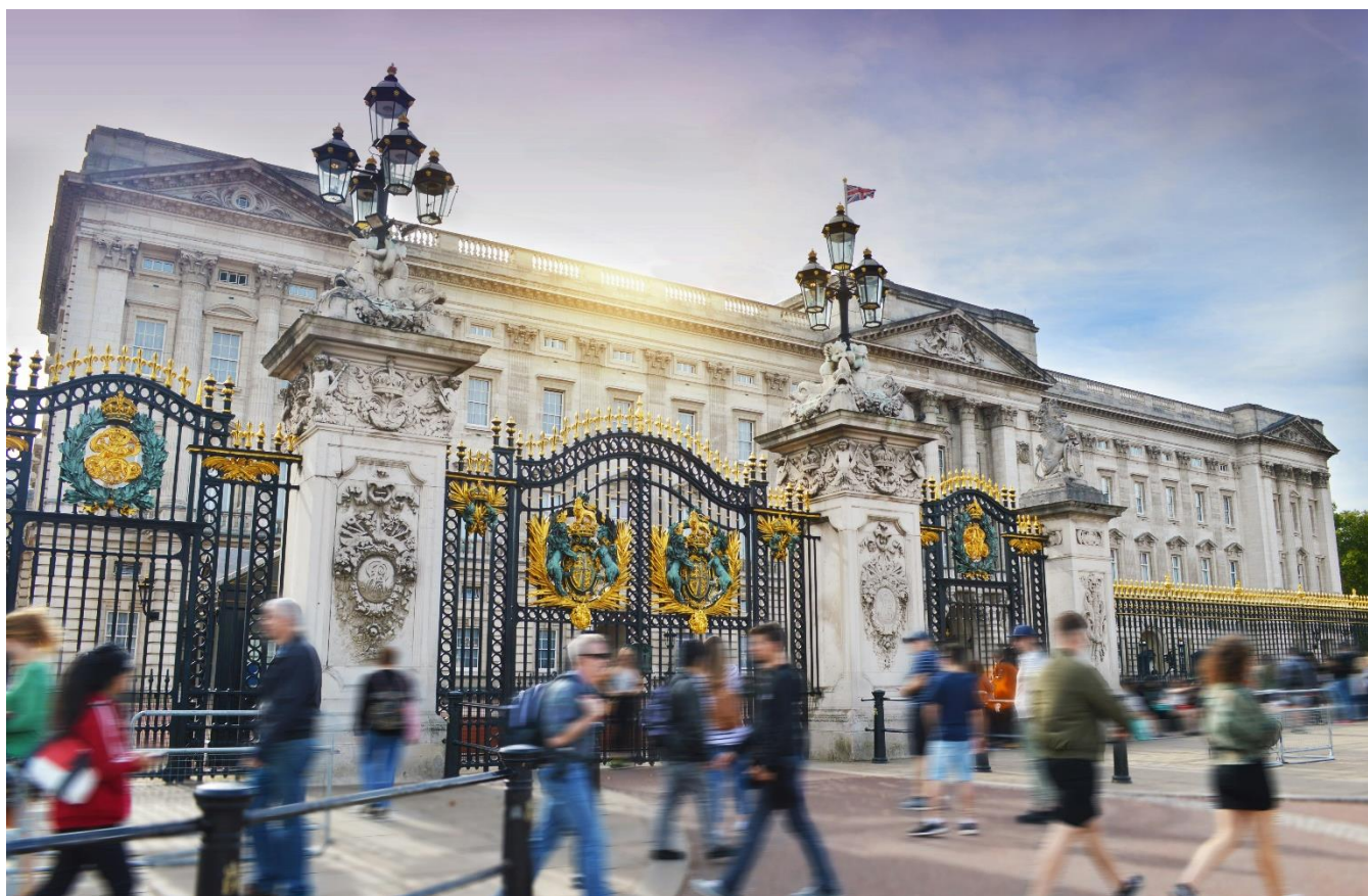
Palácio de Buckingham, Londres, Inglaterra

Café da manhã no hotel e saída para visita panorâmica pela vibrante Londres, passando por seus ícones, como o Big Ben, o Palácio de Buckingham e a tradicional troca da guarda (quando em execução). Percurso pelos bairros centrais e entrada no Museu Britânico, com seu impressionante acervo de 8 milhões de obras. Retorno ao hotel para hospedagem.