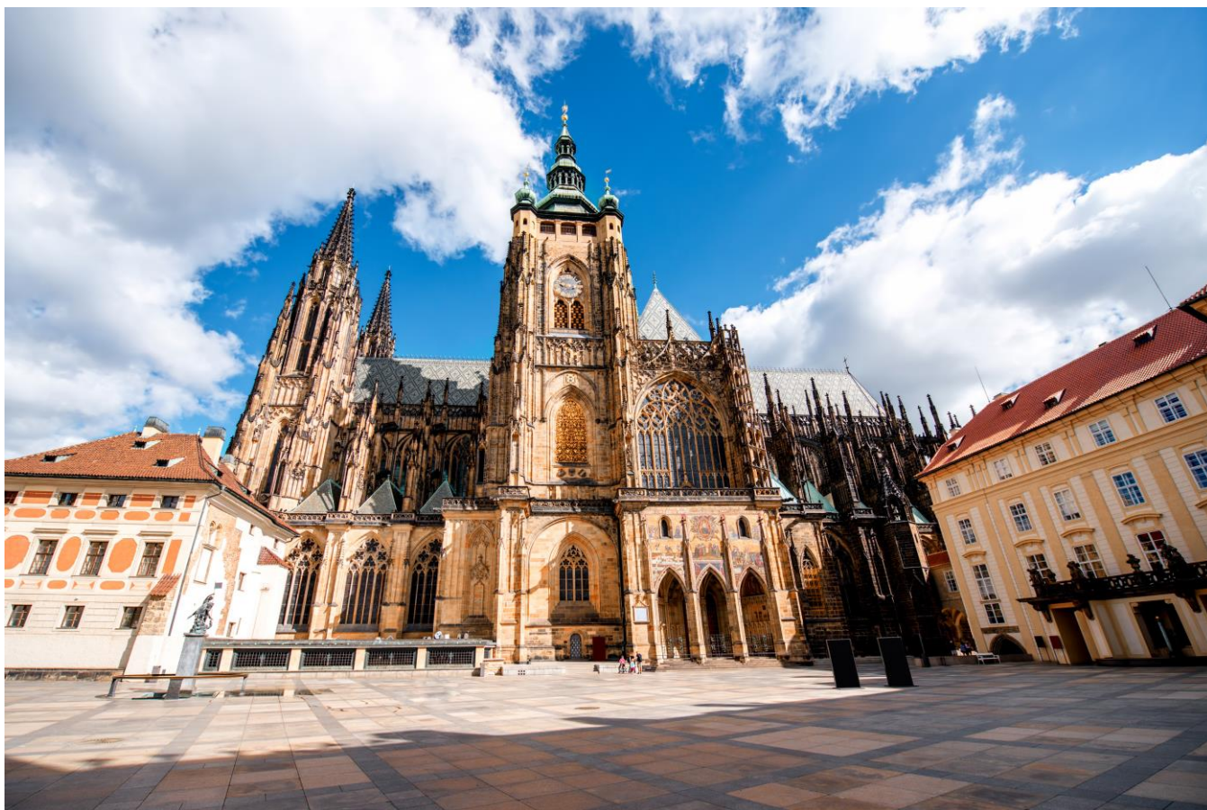
Catedral de São Vito, Praga, República Tcheca

Desfrute um café da manhã buffet no hotel e prepare-se para a visita à cidade, começando pelo bairro do Castelo Hradčany, com a Catedral de São Vito, o Castelo de Praga, o Beco de Ouro e os vários pátios do castelo. Visitaremos à “Cidade Pequena”, com a Rua Nerudova com suas belas construções antigas. Passaremos pela Igreja de São Nicolau e pela magnífica Ponte de Carlos, uma das mais antigas da Europa, que liga a “Cidade Pequena” à Cidade Antiga, e apreciaremos a bela vista. Caminhada pela Rua Karlova até a Praça da Cidade Antiga com seu Relógio Astronômico, igreja gótica de Nossa Senhora de Tyn e monumento a Jan Hus. Finalmente chegaremos à Cidade Nova, onde termina nosso passeio. Praga é famosa também por sua arte em vidro e porcelana. As marionetes também são um autêntico souvenir típico da cidade. Hospedagem.