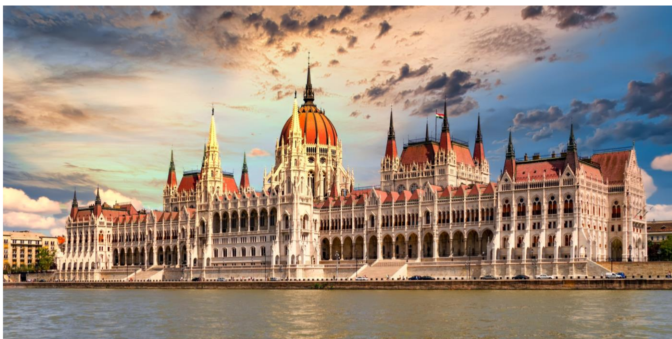
Parlamento Húngaro, Budapeste

Após o café da manhã, sairemos para Budapeste, a capital da Hungria, conhecida como a “Pérola do Danúbio”, com chegada prevista para a hora do almoço. À tarde, visita da cidade. Budapeste está dividida em duas partes: “Buda”, onde se encontra o centro histórico, embaixadas e residências da alta sociedade, e “Pest”, onde estão a maioria dos hotéis e lojas. No primeiro dia visitaremos Pest e a Praça dos Heróis, onde está localizado o Monumento do Milênio. No seu pedestal estão as estátuas dos sete conquistadores e do seu líder Árpád.