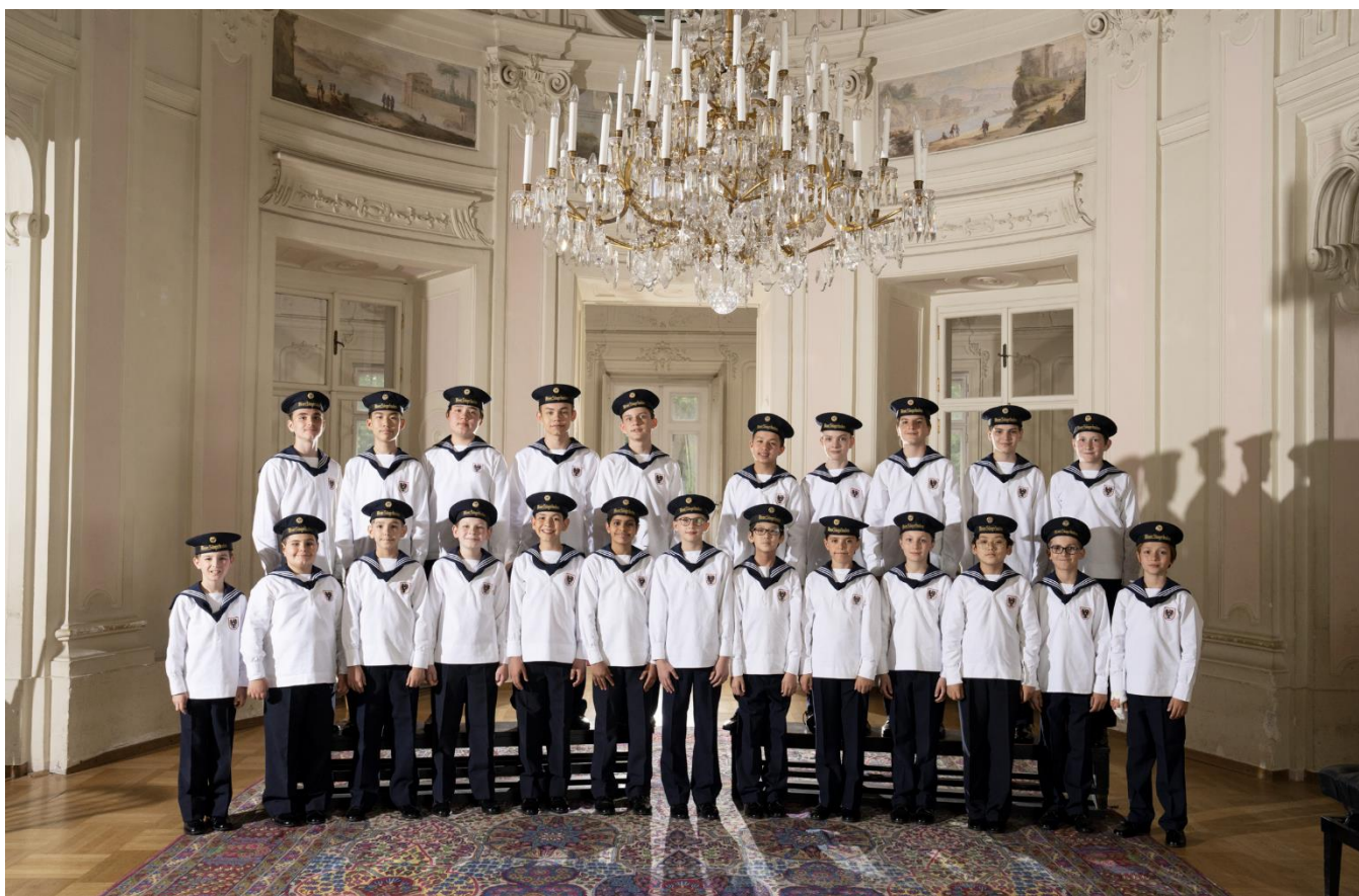
Talentosos meninos cantores em Viena, Áustria.

Passaremos pela Ringstrasse, com seus magníficos edifícios, como a Ópera Estatal, o Museu de História da Arte e História Natural, Monumento a Maria Theresa, Parlamento Austríaco, Prefeitura de Viena, Teatro Nacional, Hofburg e visitaremos o interior da Catedral de Santo Estêvão. Passaremos pelo Relógio Anker, pelo bairro judeu e pela Maria Theresien-Platz. À tarde, nos espera uma experiência única e inesquecível. Em primeiro lugar, faremos uma visita guiada exclusiva ao Palácio Augarten e ao internato dos Meninos Cantores de Viena. Conheceremos de perto a estrutura dos coros e mergulharemos em 500 anos de tradição do canto. A oportunidade de assistir a um ensaio do coro para o próximo concerto é especialmente única. Após o ensaio, nos prepararemos para o concerto no Teatro Muth com uma taça de champanhe. Os 24 meninos com trajes de marinheiro nos encantarão com suas habilidades e nos levarão em uma viagem pela história da música com Haydn, Mozart, Schubert, Strauss, músicas internacionais e pop. Emocionados e profundamente impressionados com o talento dos meninos, retornaremos juntos ao hotel. Hospedagem.