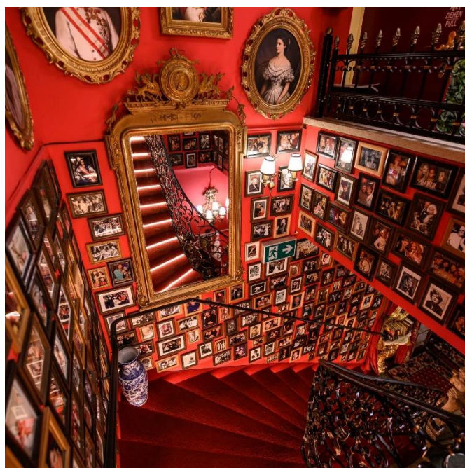
Restaurante Marchfelderhof, Viena, Austria.

Neste ambiente verdadeiramente único, você logo terá a sensação de que a Imperatriz Sissi está sentada à mesa, ao seu lado. Claro, as bebidas também estão incluídas. Hospedagem.