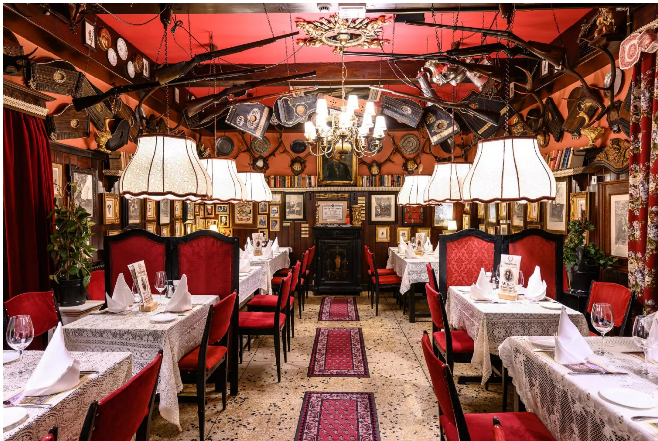
Restaurante Marchfelderhof, Viena, Austria.

Recepção no aeroporto e traslado para o hotel. À noite, encontro com os seus companheiros de viagem em um típico jantar austríaco de boas-vindas, no restaurante Marchfelderhof, internacionalmente famoso.