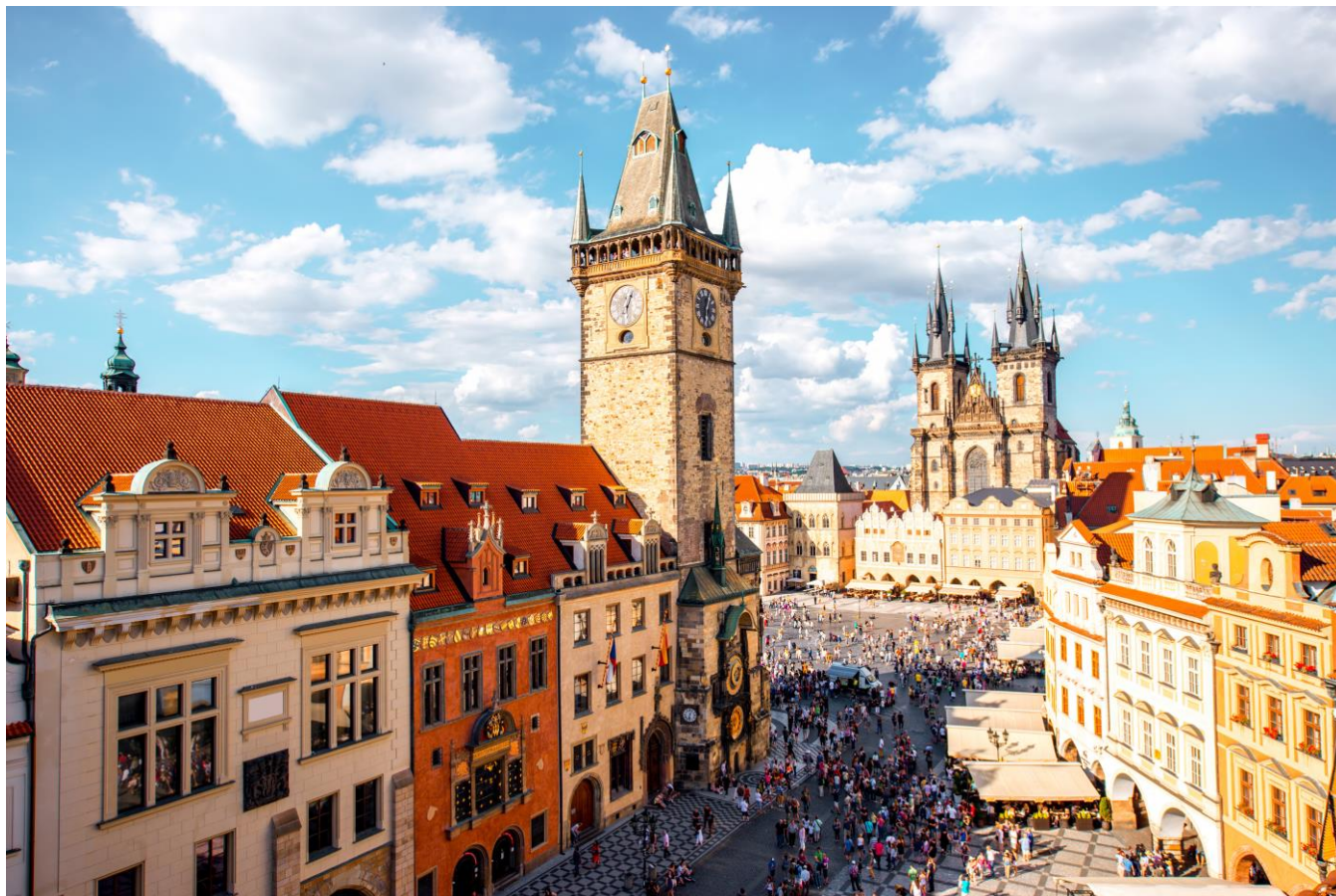
Praça da Cidade Antiga, Praga, República Tcheca