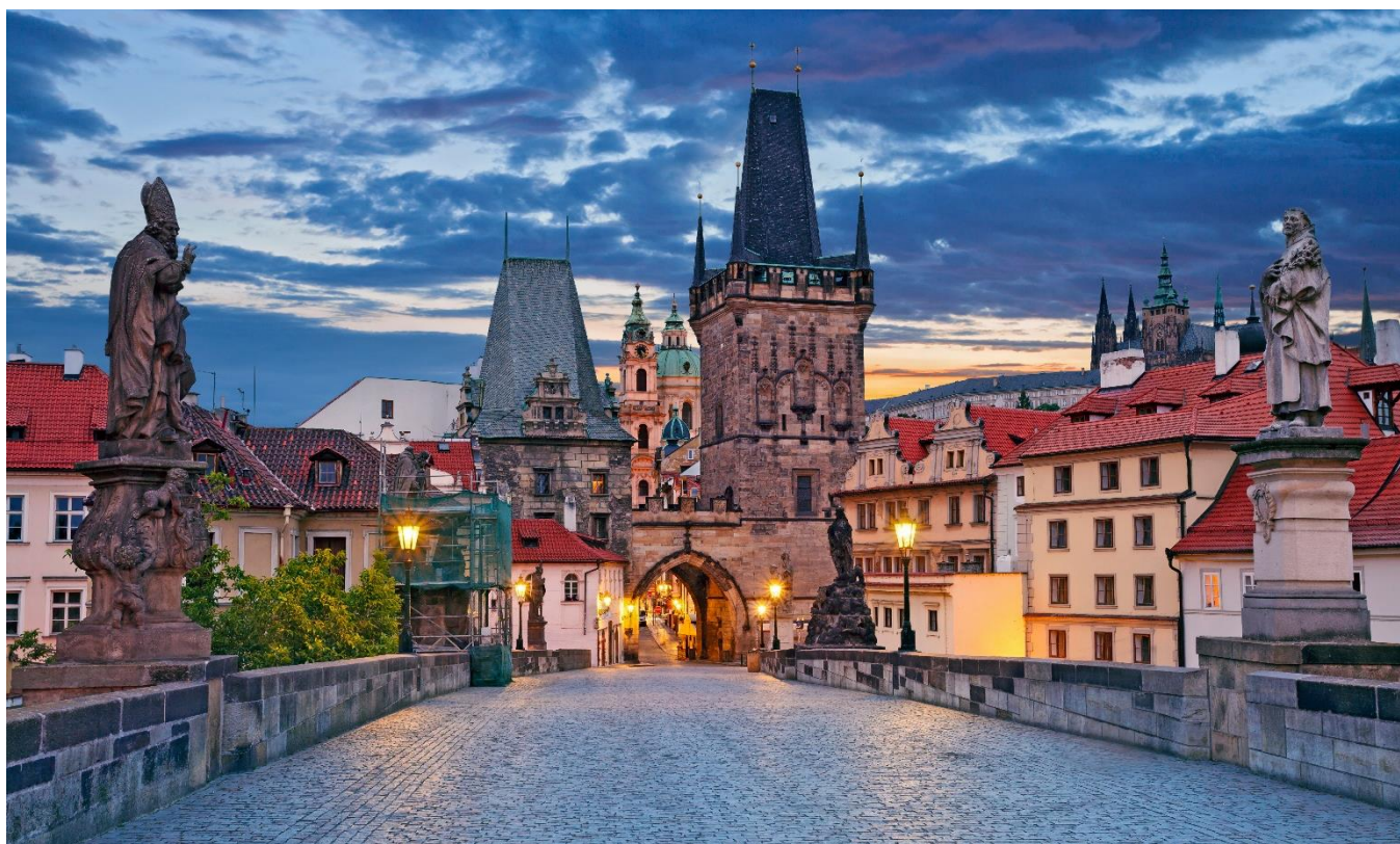
Praga, República Tcheca

Após o café da manhã, sairemos para Praga, a belíssima capital da República Tcheca, com breve parada na capital eslovaca, Bratislava. Em Praga, faremos um inesquecível percurso turístico pelo centro histórico da cidade.