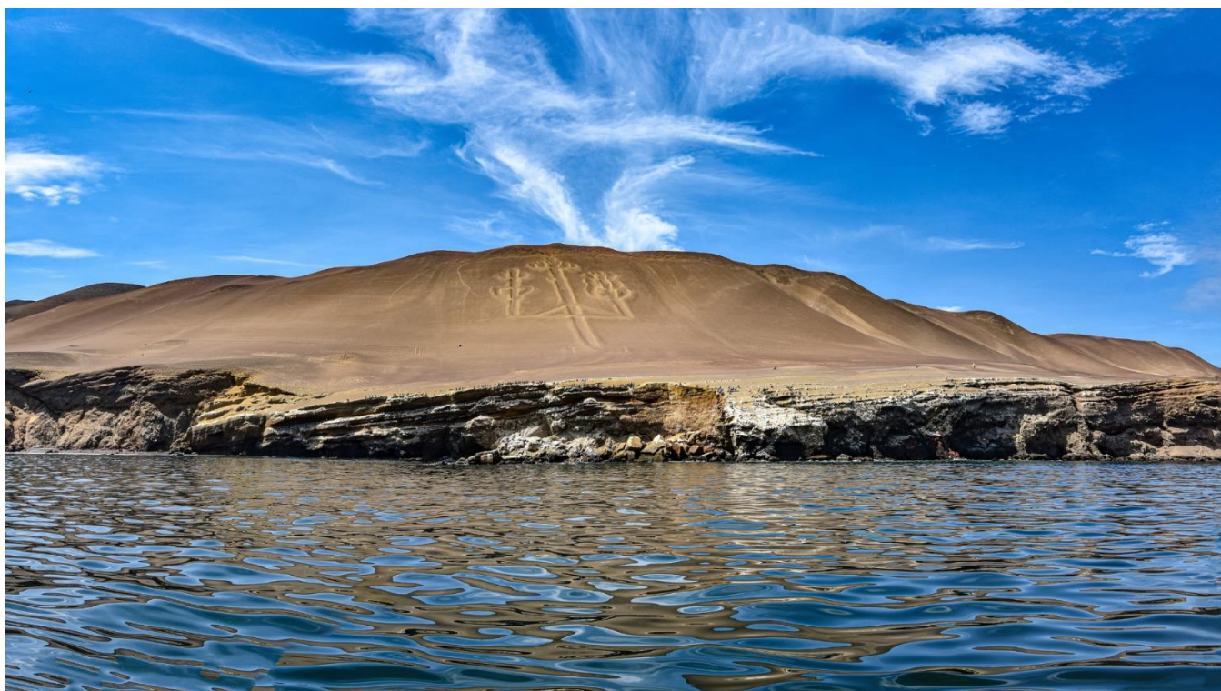
Baía de Paracas, Peru