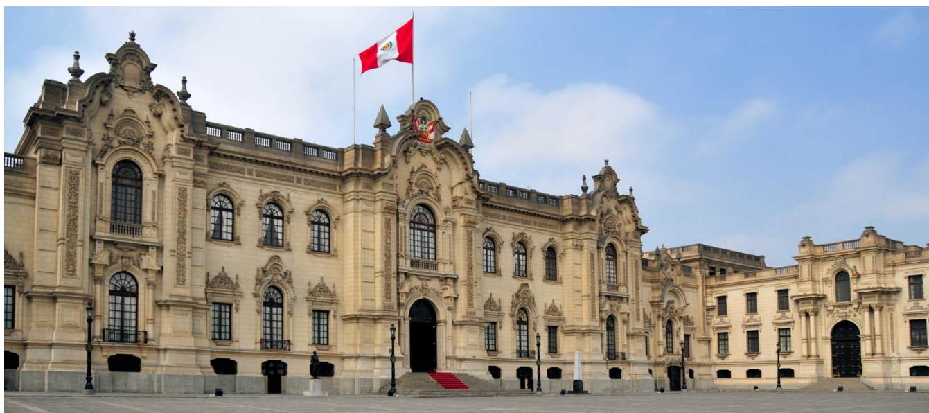
Palácio do Governo, Lima, Peru

Construído durante a fundação de Lima, foi nesse recinto que se fundou a Universidade Maior de São Marcos, a mais antiga da América. No interior dele, os assentos mais antigos do país e a biblioteca com 25.000 livros, alguns impressos no século XV, de valor histórico impagável. Os restos de São Martín de Porres, São João Macías e Santa Rosa de Lima jazem em seu interior. Cruzando a Praça Maior, o Palácio do Governo e Municipal, entraremos na Catedral, joia da história de Lima, com obras de arte que nos aproximarão da Lima colonial.