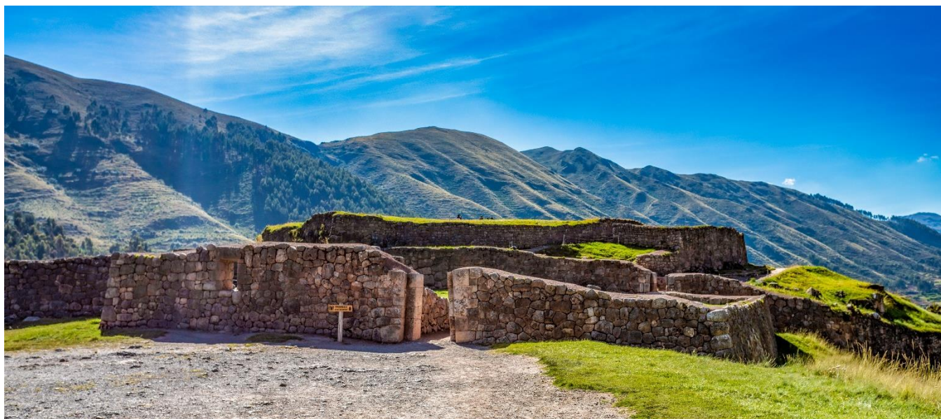
Puca Pucará, Cusco, Peru