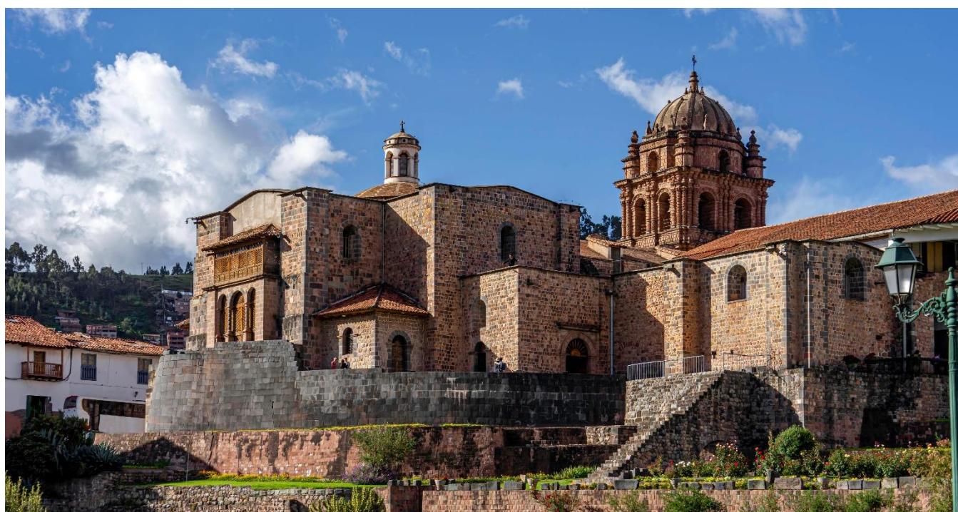
Templo de Korikancha, Cusco, Peru

Café da manhã no hotel. Em horário apropriado, traslado ao aeroporto. Saída a Cusco. Chegada e traslado ao hotel. À tarde, passeio exclusivo na cidade com visita a Praça Maior de São Cristóvão para desfrutar de uma vista panorâmica. Visitaremos o Mercado de São Pedro, nos saciaremos com o sabor local e conheceremos mais de perto os produtos da região, que tem tudo e abastece a cidade inteira.