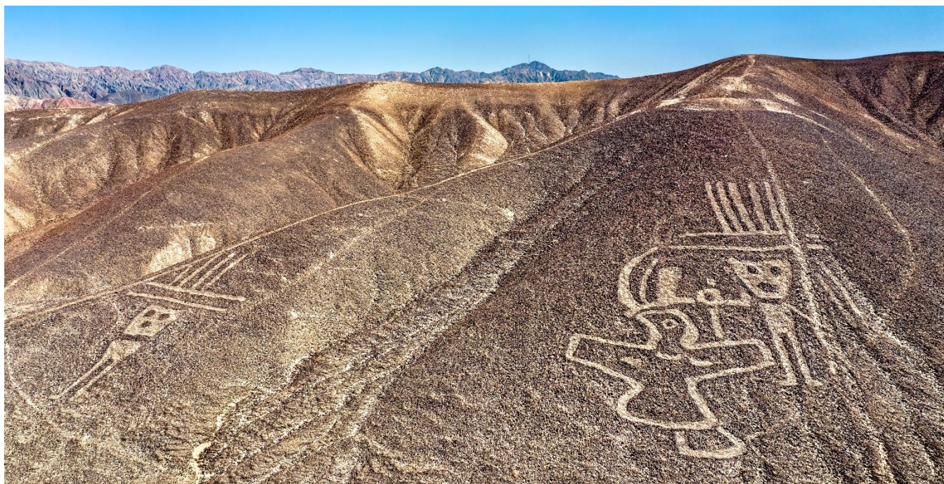
Grande pampa de Nasca, Peru

Café da manhã no hotel. Saída com destino a baía de Paracas. Chegada e assistência para embarcar nas modernas aviões de Aerodiana, Cessna Grand Caravan no aeroporto de Pisco. Sobrevoo no deserto de Ica antes de chegar ao grande pampa de Nasca, onde se encontram os misteriosos e enigmáticos desenhos e linhas perfeitas que cruzam a enorme extensão de terra.