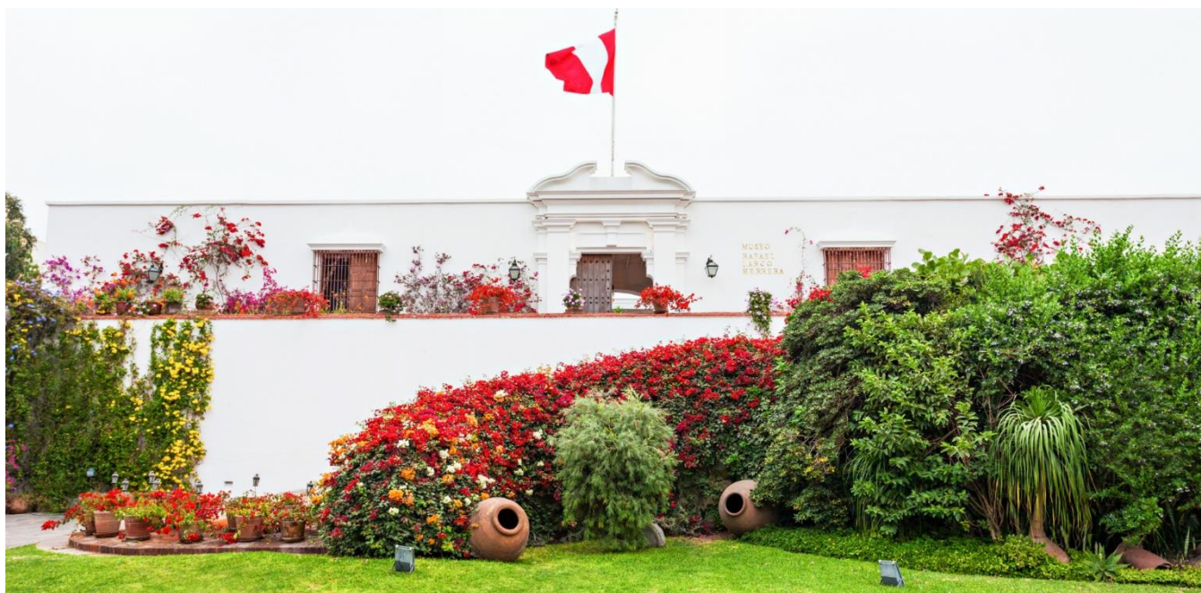
Museu Larco, Lima, Peru

Deixaremos o centro e nos dirigiremos ao Museu Larco, lugar onde teremos a clara visão das culturas que povoaram o país. Vamos nos surpreender com as peças de ouro, têxteis e cerâmicas eróticas, que são parte da coleção que nos introduzirá na cosmovisão do antigo Peru. O armazém desse museu estará aberto em nossa visita para apreciarmos as expressões de arte em suas cerâmicas. Hospedagem.