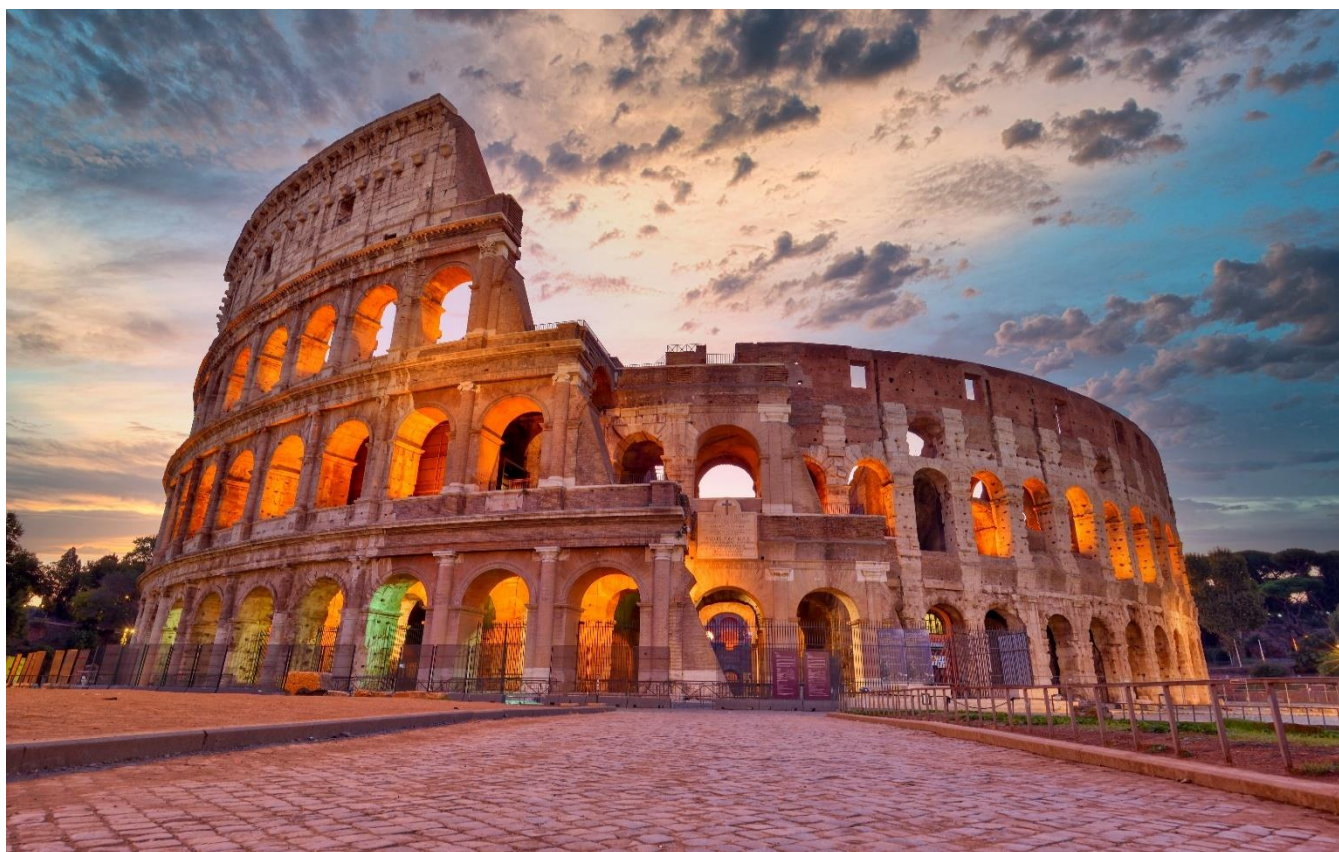
Coliseu, Roma, Itália

Apresentação no aeroporto internacional do Rio de Janeiro, Galeão, ou São Paulo, Guarulhos para embarque com destino a Roma.