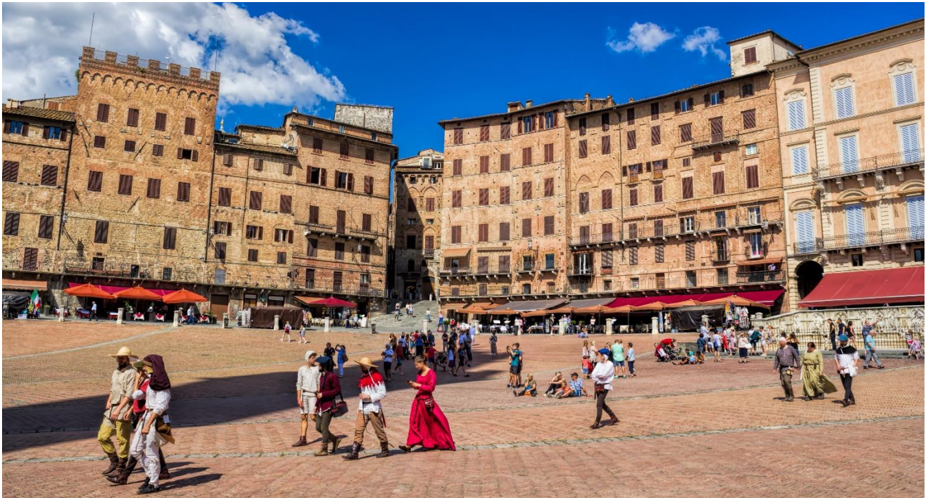
Piazza del Campo, Siena, Itália