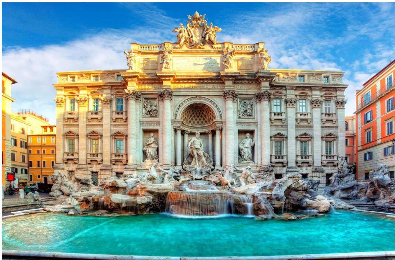
Fontana di Trevi, Roma, Itália

espetacular dos monumentos mais icônicos da Cidade Eterna. Tudo o que você precisa fazer é embarcar, relaxar, ouvir os comentários em áudio em 12 idiomas e embarcar e desembarcar em qualquer uma das oito paradas ao longo do percurso. O bilhete é válido por todo um dia. Retorno ao hotel por conta própria. Hospedagem.