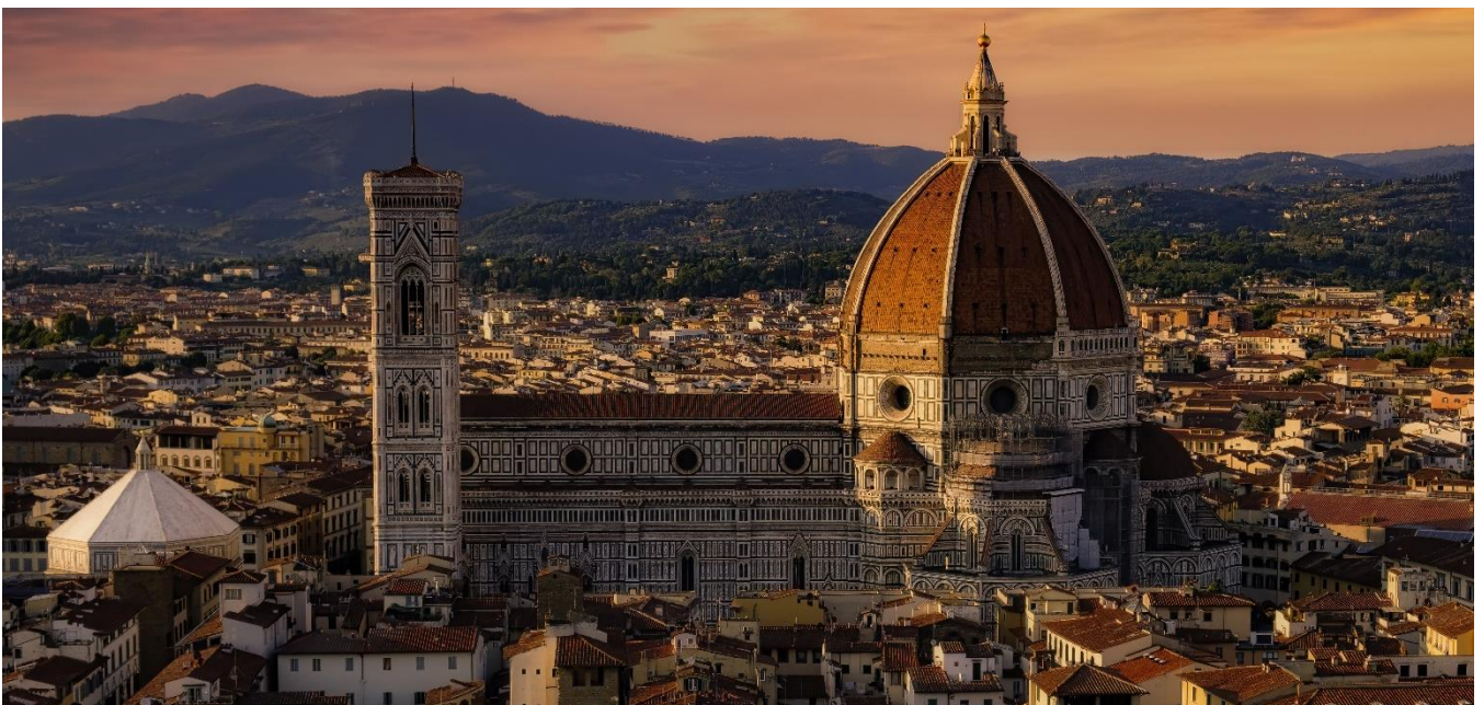
Catedral de Santa Maria del Fiore, Florença, Itália

Após o café da manhã no hotel, visita a esta magnífica cidade, onde o gênio italiano se manifesta em todo o seu esplendor e pureza. O centro da cidade, juntamente com o Campanário, o Batistério e a Catedral, forma um conjunto extraordinário de mármore branco, verde e rosa, mostrando a transição da arte florentina medieval para o Renascimento.