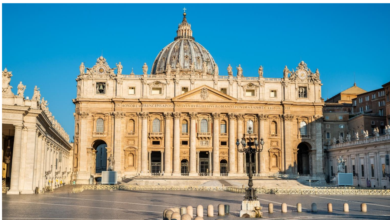
Praça de São Pedro, Roma, Itália

Café da manhã no hotel, seguido de uma visita matinal aos Museus Vaticanos, à Capela Sistina e à Praça de São Pedro.