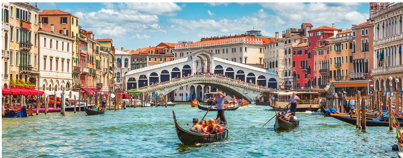
Ponte dos Suspiros, Veneza, Itália

Café da manhã no hotel e traslado para a Praça de São Marcos para um passeio pela cidade que inclui a Praça de São Marcos, o Palácio Ducal, símbolo da glória e do poder de Veneza, sede dos Doges, do governo e do tribunal de justiça, conectado ao "Palácio dos Prisioneiros" pela Ponte dos Suspiros, onde Casanova foi aprisionado.