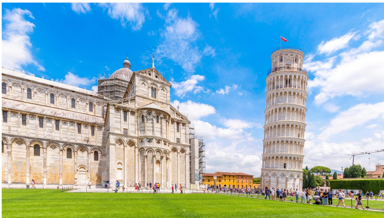
Torre de Pisa, Itália

Visite a Catedral de Santa Maria del Fiore, um símbolo da riqueza e do poder de Florença durante os séculos XIII e XIV, com a cúpula de Brunelleschi contrastando com a silhueta esguia do Campanário, projetado e iniciado por Giotto; o Batistério, uma estrutura românica famosa por suas Portas de Bronze (incluindo as Portas do Paraíso, assim chamadas por Michelangelo); a Piazza della Signoria; o Palazzo Vecchio, um edifício gótico de aparência austera; e, finalmente, a Igreja de Santa Croce, que se abre para uma das praças mais antigas da cidade. Almoço em um restaurante típico toscano no coração da Piazza Santa Croce. Tarde livre, com a opção de visitar Pisa.