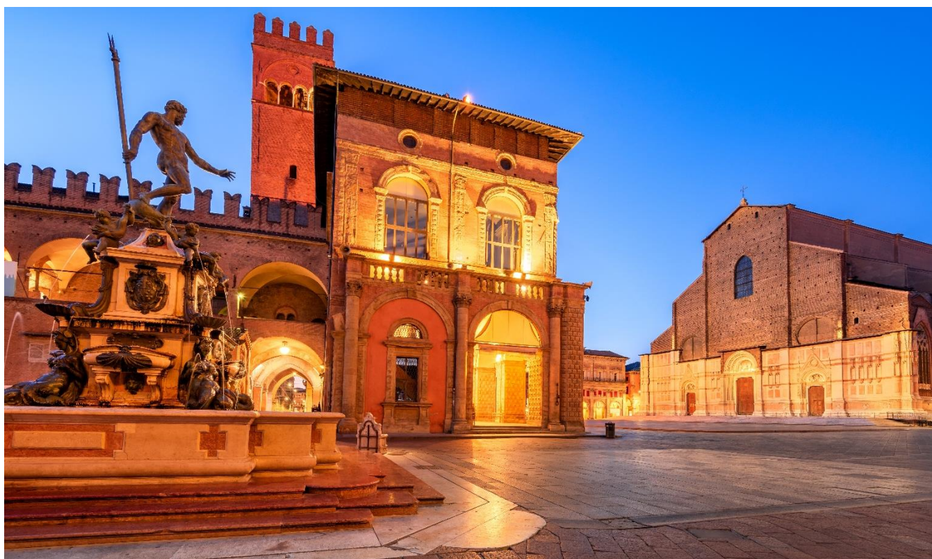
Piazza del Nettuno, Bolonha, Itália

Ali, você poderá admirar o histórico Palazzo del Podestà, bem como a Basílica de San Petronio, a maior igreja gótica do mundo construída inteiramente em tijolos. Em seguida, mostraremos por que Bolonha é frequentemente considerada a capital gastronômica da Itália, enquanto você mergulha em sua vibrante cena de comida de rua, tão rica e