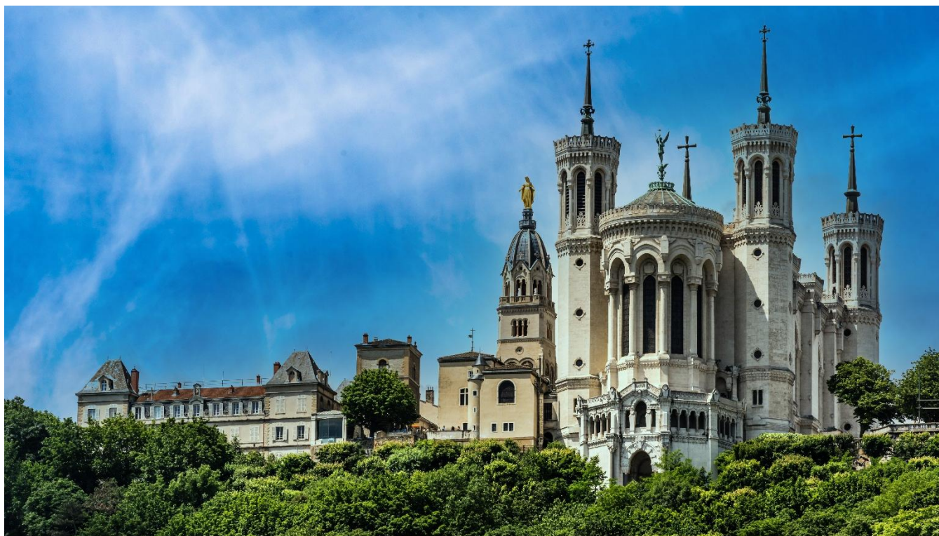
Basílica de Notre-Dame de Fourvière, Lyon, França

Café da manhã no hotel e visita panorâmica da cidade, que foi a capital dos lendários gauleses e tem o maior patrimônio renascentista do planeta, depois de Veneza e Florença. Em nossa visita panorâmica conheceremos Lyon Antiga, o bairro medieval e renascentista localizado às margens do rio Saône, Catedral de São João com seu relógio astronômico, Basílica de Notre-Dame de Fourvière, Praça da Comédia, Rua da República, Place des Terreaux e a moderna ópera de Lyon. Hospedagem.