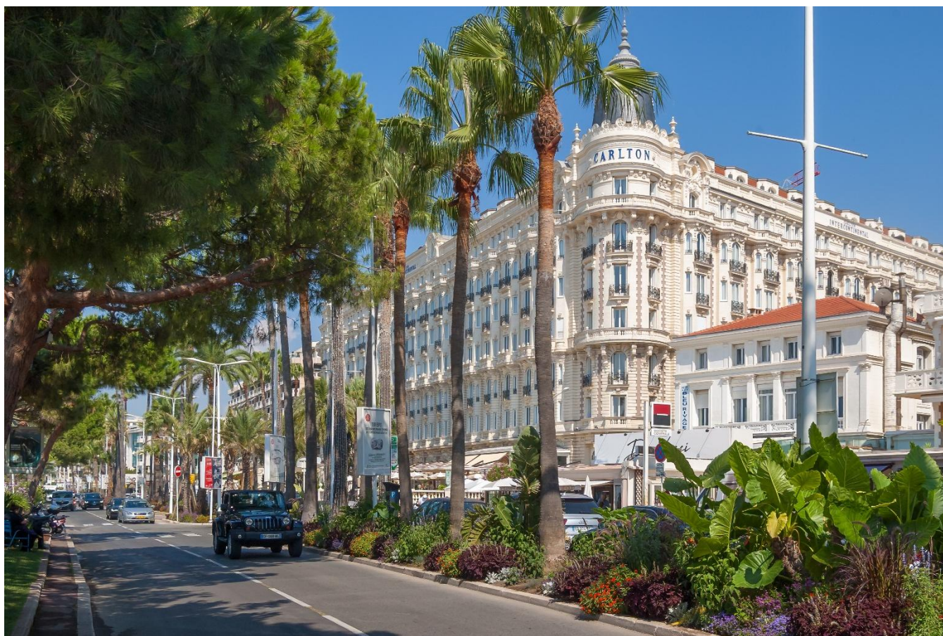
Boulevard de la Croisette, Cannes, França

Outra dica para aproveitar o tempo livre é visitar as galerias de arte onde artistas como Henri Matisse e Joan Miró deixaram sua marca nas artes. Continuação para Cannes, uma parada ideal na rota da Côte d'Azur. Cannes, conhecida mundialmente por seu famoso festival de cinema, é uma cidade para mergulhar no luxo, pois o glamour e opulência estão sempre em sintonia com o estilo que irradia da cidade. Durante o tour por Cannes passamos por bairros históricos como Le Suquet. Continuamos nosso percurso pelo Boulevard de La Croisette (principal atração turística de Cannes), conhecido por seus cafés ao ar livre, e especialmente pelas boutiques de luxo. Outras atrações turísticas da cidade são: Musée de La Castre, Capela de Sainte-Anne e a Rua d'Antibes, um lugar de glamour e para fazer compras com estilo. Retorno para Nice. Hospedagem.