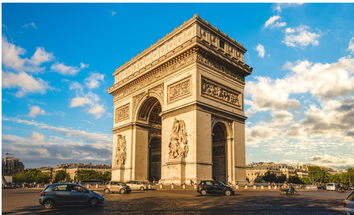
Arco do Triunfo, Paris, França

Café da manhã no hotel e visita panorâmica a uma das capitais mais turísticas e visitadas do planeta. Durante nosso percurso, passaremos pelo famoso bairro de Saint-Germain, com sua atmosfera intelectual e ponto de encontro de Hemingway, Sartre e Picasso. Passaremos pela Universidade de Sorbonne, uma das mais antigas e importantes do planeta, Champs-Élysées, Praça da Concórdia, Arco do Triunfo, cruzaremos algumas das belas pontes de Paris sobre o Rio Sena, até chegarmos à Torre Eiffel, onde tiraremos uma foto do monumento mais famoso da França, e seguiremos para Les Invalides, onde está o túmulo de Napoleão, La Madeleine, o Panteão e outros lugares que fazem de Paris uma cidade encantadora. À tarde, opção de fazer a visita opcional a pé pelo Quartier Latin, Montmartre, Catedral de Notre Dame (visita externa) e passeio de barco pelo Rio Sena (não incluído). Hospedagem.