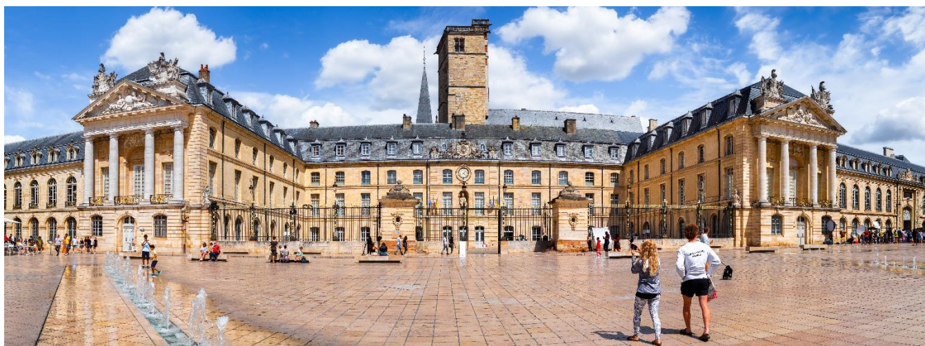
Palácio dos Duques da Borgonha, Dijon, França

Café da manhã no hotel e saída para Épernay, com visita à famosa vinícola Mercier. Após a visita continuaremos a nossa viagem para Dijon. Chegada e acomodação. À tarde, visita panorâmica da cidade de Dijon, uma das mais importantes da França, capital da Borgonha, terra da mostarda, famosa por seu esplendor arquitetônico renascentista, herança dos Duques da Borgonha. Visitaremos o Palácio dos Duques, a Igreja de São Miguel, a típica Rua Verrerie e a Praça Darcy. Hospedagem.