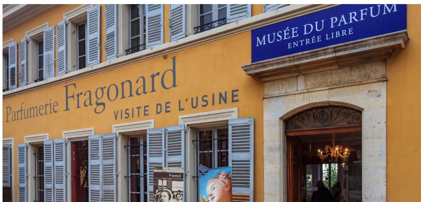
Casa Fragonard, Grasse, França

Café da manhã no hotel. Visita a Grasse, capital da região da Provença, cidade famosa por ser o centro mundial da indústria de perfumes e fragrâncias. Grasse está estrategicamente localizada em uma colina a 750 metros de altitude, rodeada de rosas, jasmims, tuberosas e outras flores que servem de matéria-prima para os famosos perfumes. Com o nosso passeio por Grasse faremos uma viagem olfativa sem precedentes, pois não visitaremos apenas a Casa Fragonard, mas também conheceremos a história desta perfumaria e descobriremos o processo criativo que envolve a produção de fragrâncias famosas. Retorno para Nice. Hospedagem.