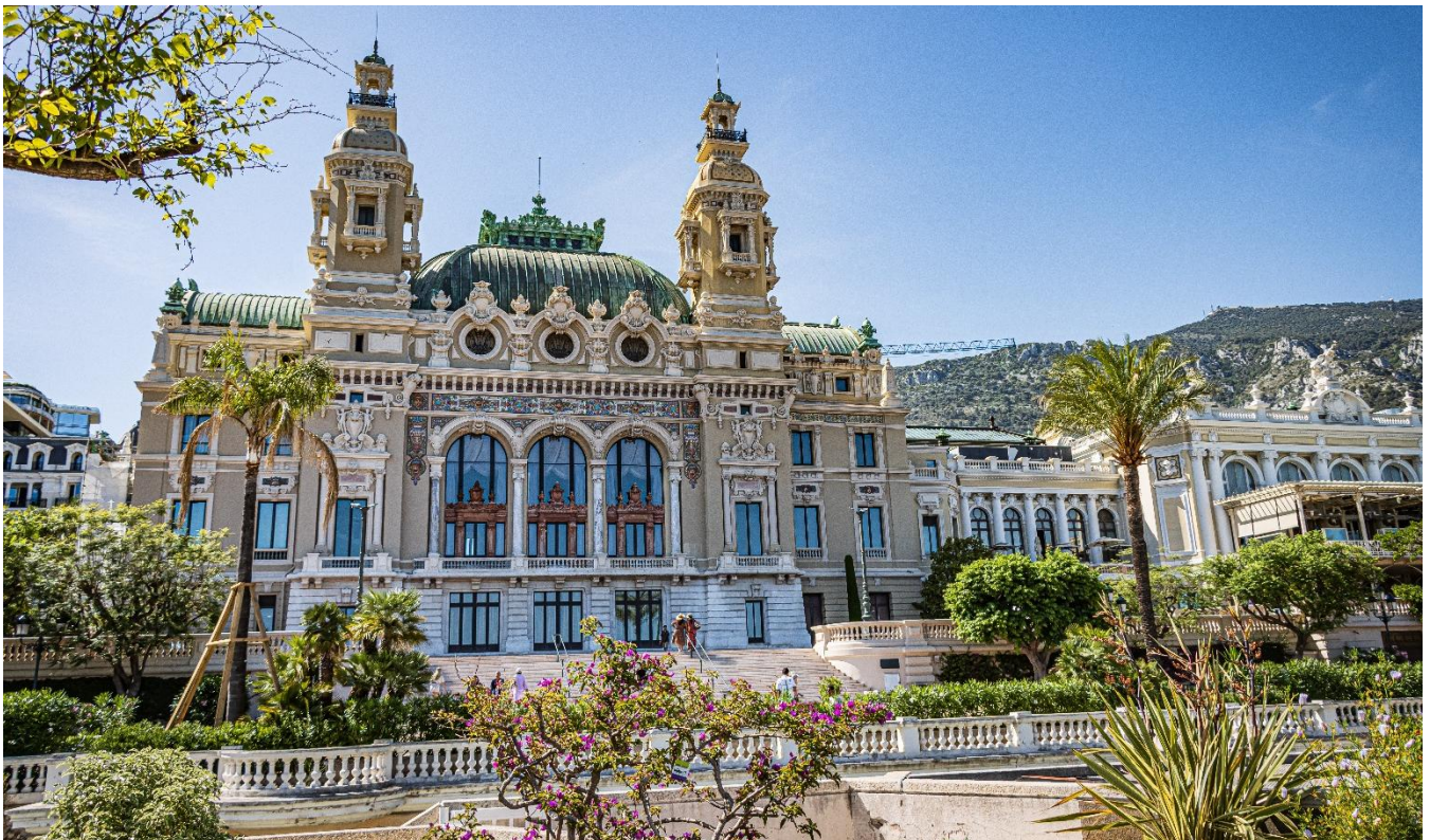
Cassino de Monte Carlo, Mônaco

Para os aventureiros que decidem tentar a sorte, o Cassino de Monte Carlo é uma das principais atrações de Mônaco. Charles Garnier, arquiteto da majestosa Ópera de Paris trabalhou também no projeto do Casino. Para visitá-lo é necessário apresentar o passaporte e seguir o “código de vestimenta”.