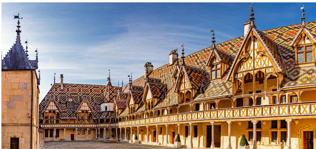
Hotel Dieu, Beaune, França

Café da manhã no hotel e saída para Beaune, uma das cidades mais bonitas da França, com seu centro antigo com muralhas e seu famoso Hotel Dieu. No final da visita, continuação da viagem para Lyon, a terceira maior cidade da França. Chegada e hospedagem.