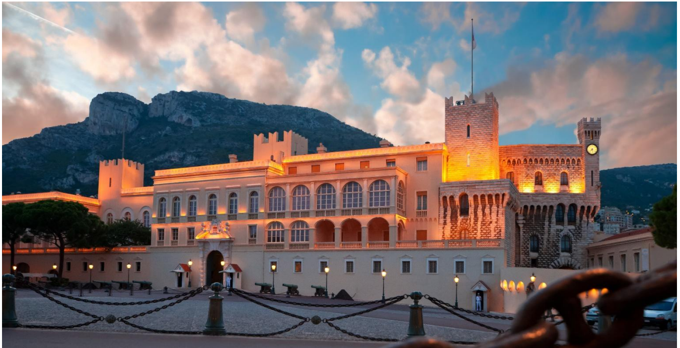
Praça do Palácio, Mônaco

Para os aventureiros que decidem tentar a sorte, o Cassino de Monte Carlo é uma das principais atrações de Mônaco. Charles Garnier, arquiteto da majestosa Ópera de Paris trabalhou também no projeto do Casino. Para visitá-lo é necessário apresentar o passaporte e seguir o “código de vestimenta”.