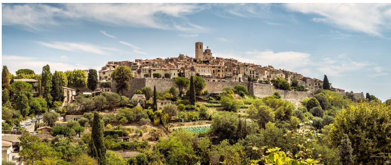
St. Paul de Vence, França

Café da manhã no hotel. Continuamos nossa jornada com uma excursão a dois lugares deslumbrantes nesta região: St-Paul-de-Vence e Cannes. Iniciaremos nossa visita em St. Paul de Vence, considerada uma das cidades mais fotogênicas da Côte d'Azur, que encanta visitantes de todo o mundo. Com este tour faremos uma viagem no tempo, pois aprenderemos um pouco mais sobre a história deste lugar encantador. Protegida por uma grande muralha na época medieval, St. Paul de Vence foi uma espécie de forte militar devido à localização estratégica. Tempo livre para passear pelas ruas medievais e para visitar Fontaine de Saint Paul de Vence, a antiga praça.