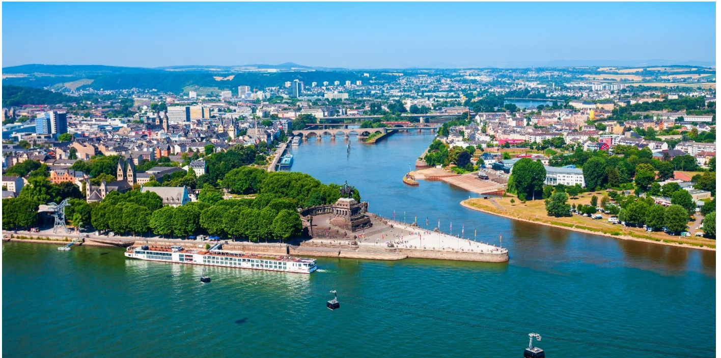
Deutsches Eck (Esquina Alemã), onde acontece o encontro dos rios Reno e Mosela

dos rios Reno e Mosela, um dos cenários mais simbólicos da Alemanha, marcado pela imponente estátua equestre do Imperador Guilherme I.