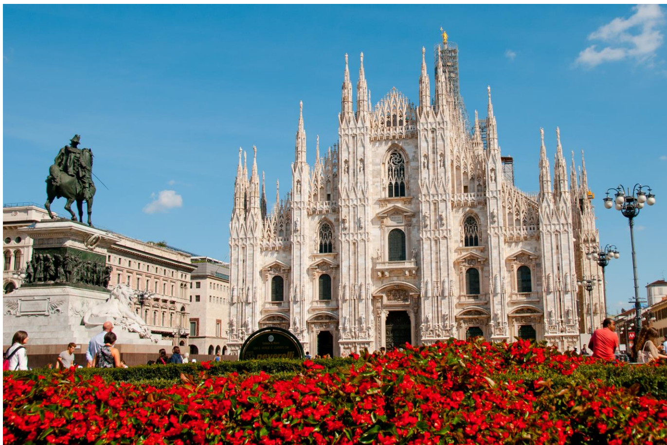
Piazza del Duomo e a Catedral de Milão

Restante do dia livre para atividades independentes, compras ou para explorar o vibrante ambiente da cidade. Hospedagem.