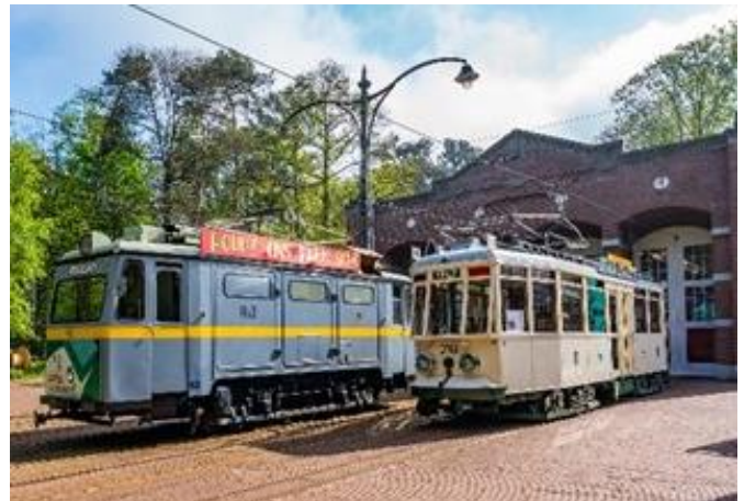
Museu a Céu Aberto, em Arnhem