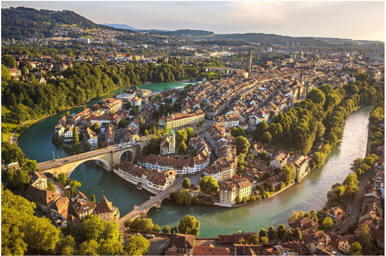
Vista panorâmica da cidade velha de Berna, capital da Suíça, vista de cima.

e o Rio Aar. Restante do dia livre para atividades independentes e para desfrutar do agradável ambiente da capital suíça.