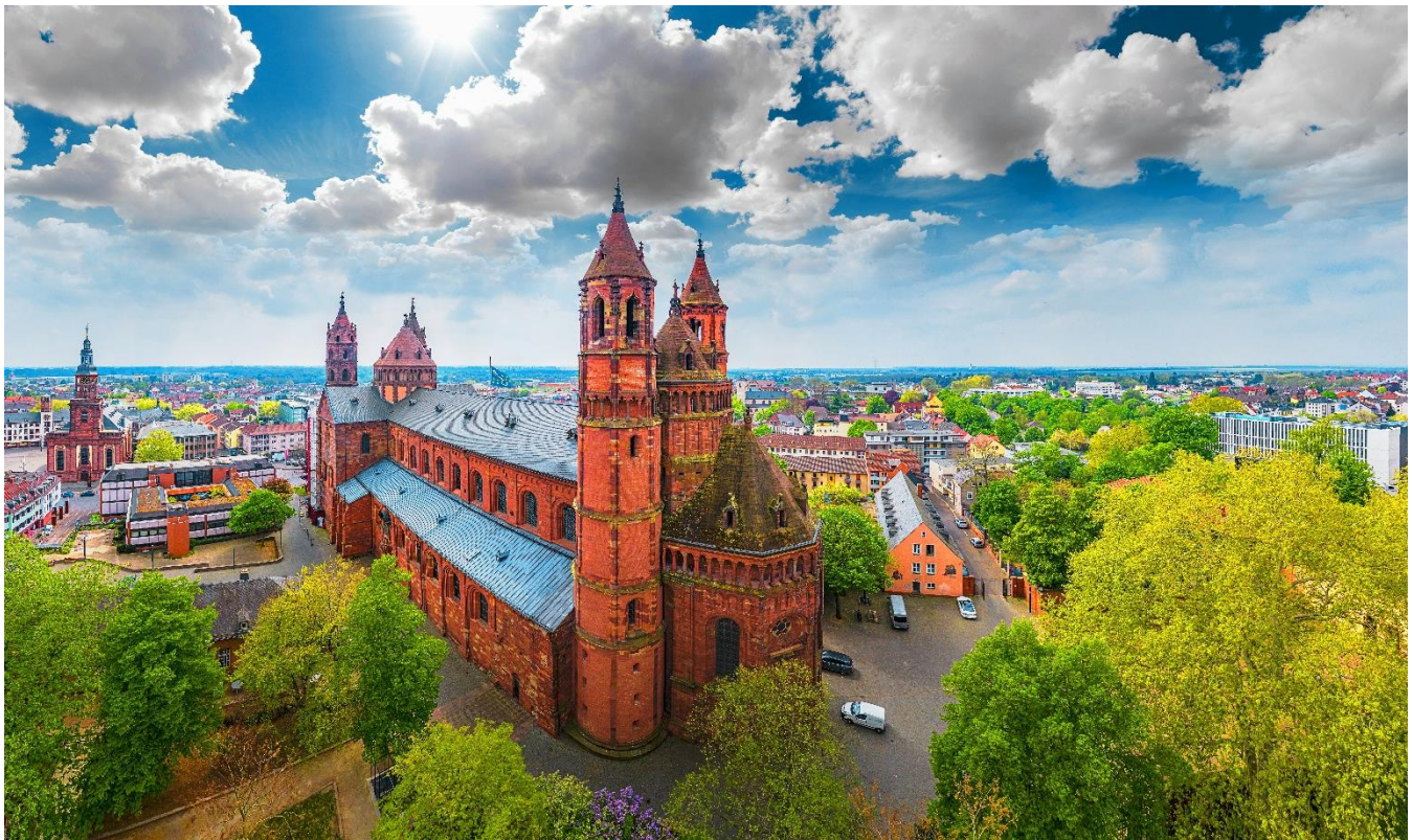
Vista aérea da catedral de Mainz, Alemanha

Retorno ao navio e início da navegação noturna em direção a Estrasburgo.