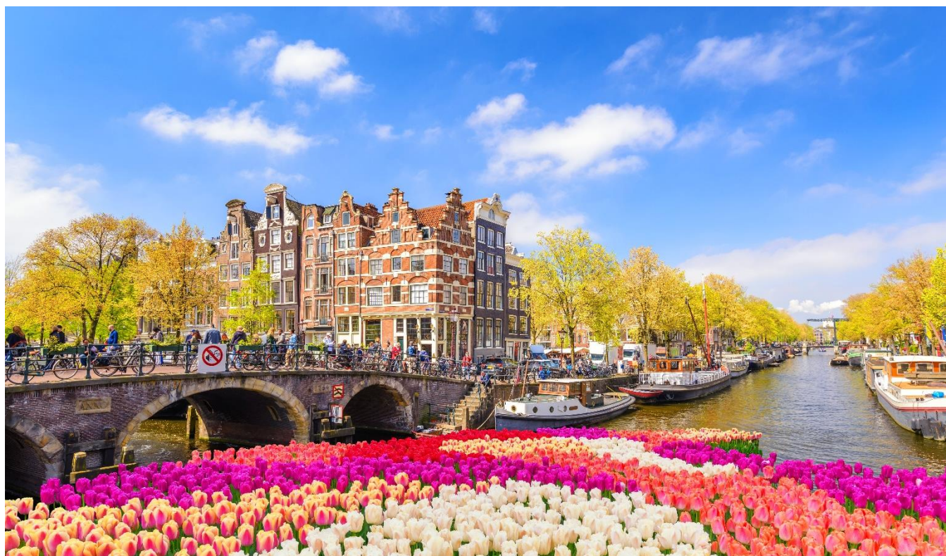
Canal em Amsterdam

Apresentação no aeroporto internacional do Rio de Janeiro, Galeão, ou em São Paulo, Guarulhos, para embarque com destino a Europa.