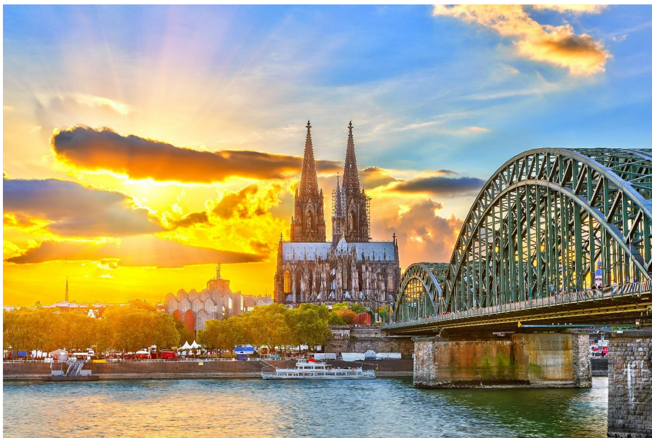
A famosa Catedral de Colônia e a Ponte Hohenzollern, Colônia, Alemanha

Pensão completa a bordo. Após o café da manhã, sairemos para uma visita guiada a Colônia, uma das mais importantes cidades históricas da Alemanha. O destaque é sua magnífica Catedral, considerada uma das maiores obras-primas da arquitetura gótica europeia e um dos monumentos mais emblemáticos do país. Em seguida, passeio pelo charmoso centro histórico, repleto de praças, construções tradicionais e agradáveis ruas comerciais. Haverá ainda tempo livre para explorar a cidade no seu próprio ritmo ou conhecer a tradicional loja da famosa Água de Colônia.