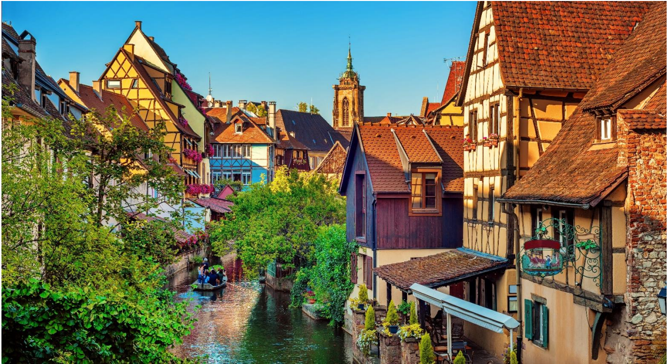
Colmar, Alsácia, França - Pequena Veneza

À tarde, saída para Colmar, uma das cidades mais encantadoras da Alsácia. Conhecida por suas coloridas casas em estilo enxaimel, ruas floridas e canais pitorescos, a cidade preserva todo o charme de sua herança medieval. Durante a visita, destaque para o famoso bairro da Pequena Veneza, um dos cenários mais fotogênicos da região.