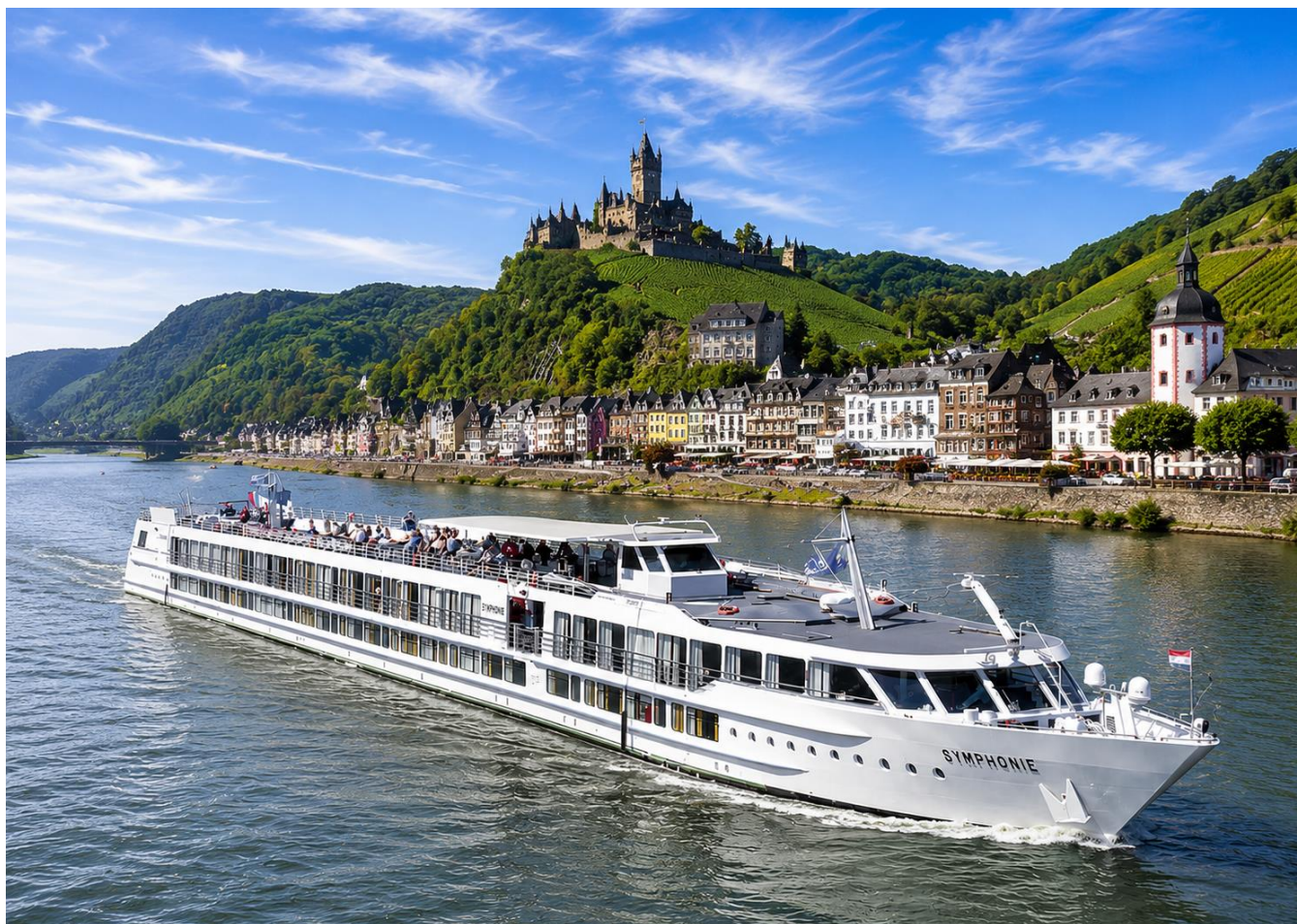
Cruzeiro Fluvial navegando no Rio Reno