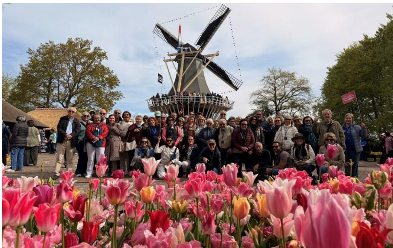
Grupo de Passageiros no Parque das Tulipas - Keukenhof, Amsterdam