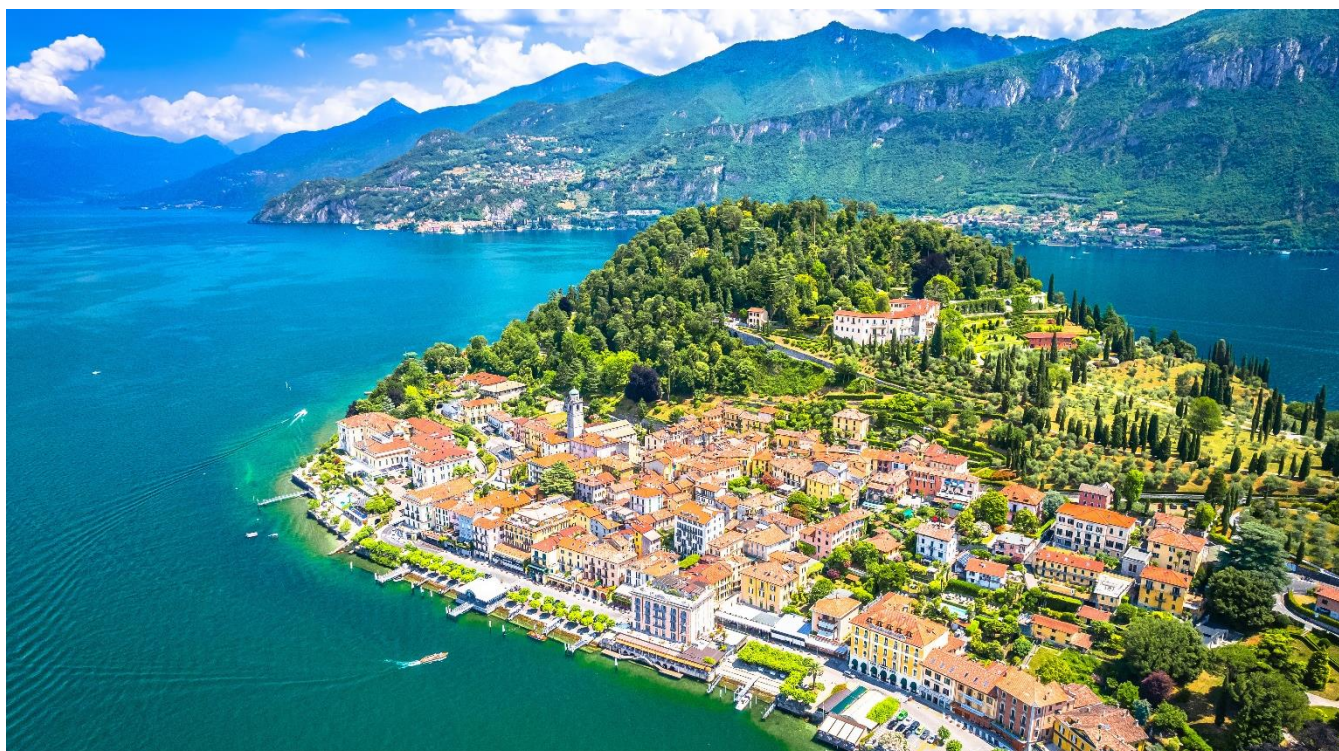
Cidade de Bellagio, às margens do Lago Como

O roteiro contempla visita a Bellagio, conhecida como a "Pérola do Lago", um dos mais belos vilarejos da Itália, famoso por suas ruas floridas, praças e espetaculares panoramas sobre o lago. Retorno a Milão e hospedagem.