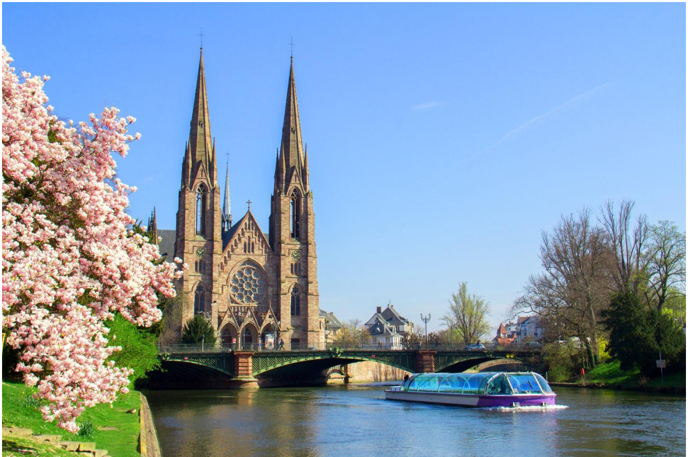
Igreja em Estrasburgo - Alsácia, França

Retorno ao navio e continuação da navegação em direção a Breisach am Rhein. À noite, celebração da tradicional Noite de Gala, com o elegante Jantar do Capitão a bordo.