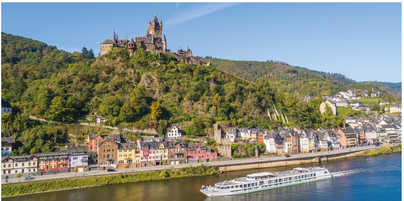
Vista deslumbrante do Rio Reno com um de seus emblemáticos castelos

Pensão completa a bordo. Pela manhã, navegação em direção a Mainz pelo trecho mais espetacular do Rio Reno, cenário de castelos medievais, vinhedos e charmosas vilas que tornam esta região uma das mais belas paisagens fluviais da Europa.