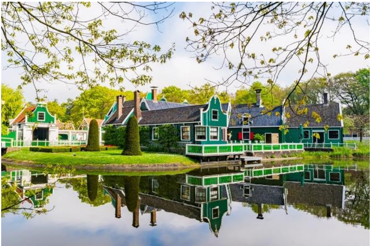
Charmosas casas verdes da região de Zaan