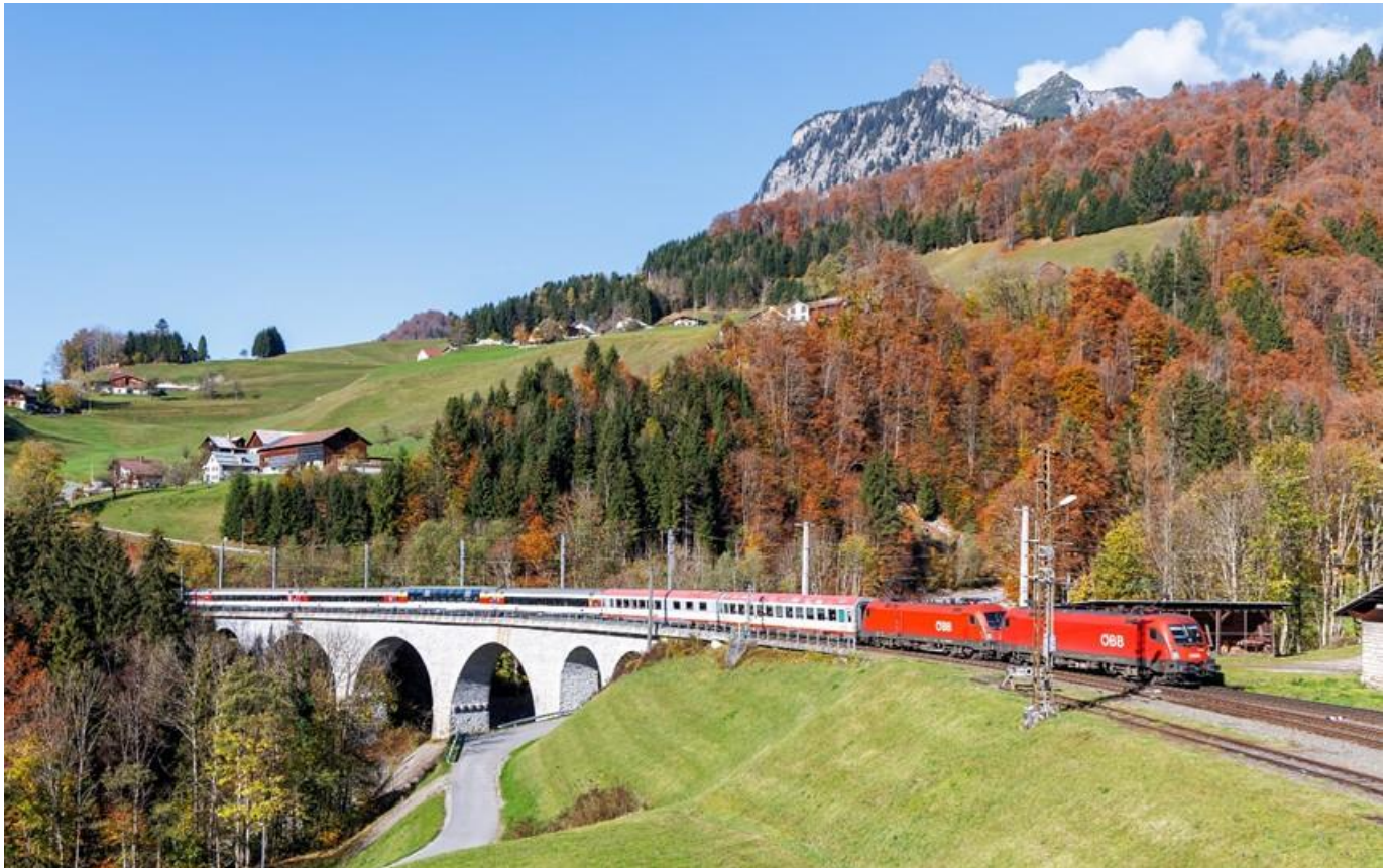
Trem de passageiros EuroCity

Alpes suíços em uma das mais belas rotas ferroviárias da Europa. O trajeto passa pelo impressionante Túnel de Base do Gotardo, uma das maiores obras de engenharia ferroviária da terra, e oferece todo o conforto dos trens de alta velocidade europeus, com amplos assentos e serviços a bordo, transformando o deslocamento em uma experiência tão memorável quanto o próprio destino. Chegada a Milão, uma das capitais mundiais da moda e do design, e hospedagem.